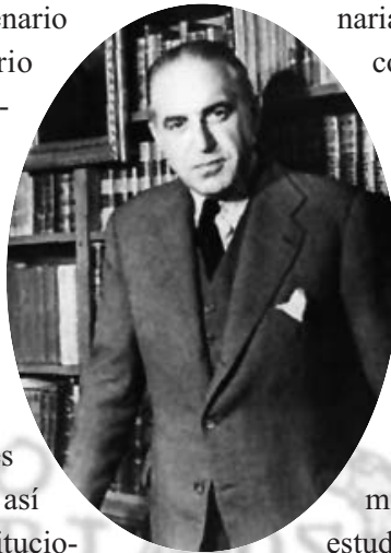
Gregorio Marañón Posadillo

La exposición que inauguraron los Reyes el día 22 de marzo en la Biblioteca Nacional tiene el título Marañón. Médico Humanista y Liberal , que sintetiza las tres facetas de la vida de Marañón. Su extraordi-