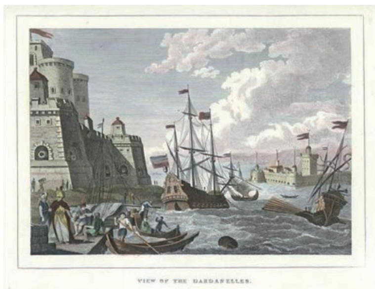
Panorámica de los Dardanelos

que fue convenientemente puesta a punto mediante su carenado, completo de su dotación y embarque de los suministros necesarios para llevar a cabo tan largo viaje hasta Constantinopla. Se trató de una larga singladura en la que la Soledad empleó más de nueve meses, llegando a Los Dardanelos el 9 de junio de 1809 31 . Todos estos gastos eran sufragados por las sobrecargadas y escuálidas arcas de la Junta de Gobierno de Cartagena, que las acometía usando los fondos que le remitía la Suprema Junta del Reino.