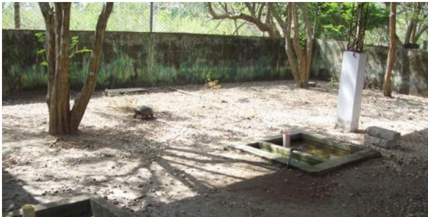
Figura 1. Área de experimentación en la granja El Perico, Universidad de Sucre

Se definieron conductas (estados) que se agruparon en categorías (pautas y eventos) comportamentales y se relacionaron con aspectos reproductivos dentro de una conducta adaptando la metodología de MIKICH (1991), a partir de las mediciones se elaboraron diagramas para facilitar la interpretación del cubrimiento de las categorías y conductas detectadas, trazando en una gráfica una línea interpretativa que permitiera diferenciar conductas particulares o específicas de tipo individual que por su naturaleza diferenciable se hicieran conspicuas (PORTO y PIRATELLI, 2005).