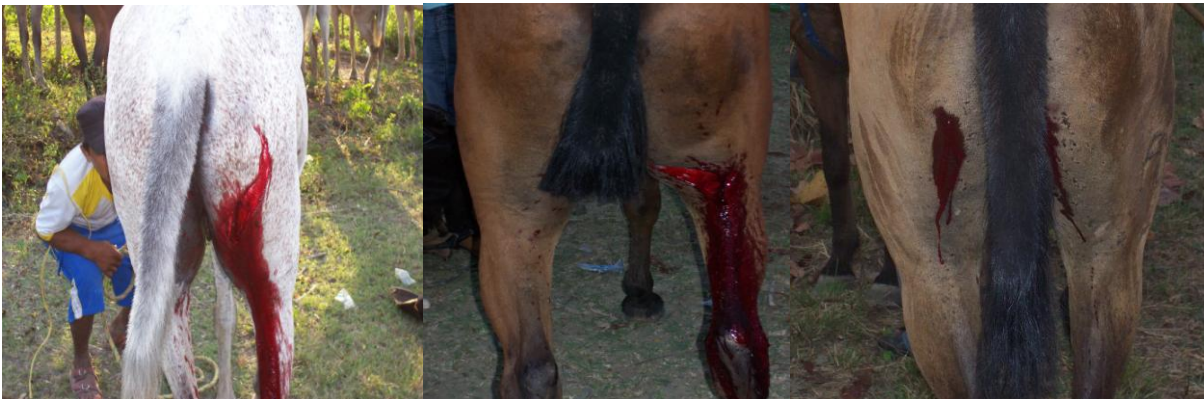
Figura 5. Lesiones en miembro posterior en caballos de garrocha, producto de cornadas.

No obstante, del afecto folclórico por las corralejas que estos pueblos llevan en la sangre, es hora de pensar en un cambio u otras estrategias, que garanticen de alguna forma la seguridad física de los caballos que participan en la faena taurina, es decir, legislar dentro de la organización de estas actividades, indumentaria de protección adecuada que cuiden a los caballos de lesiones y golpes graves que le puedan causar traumas, incapacitantes o la muerte a estos semovientes.