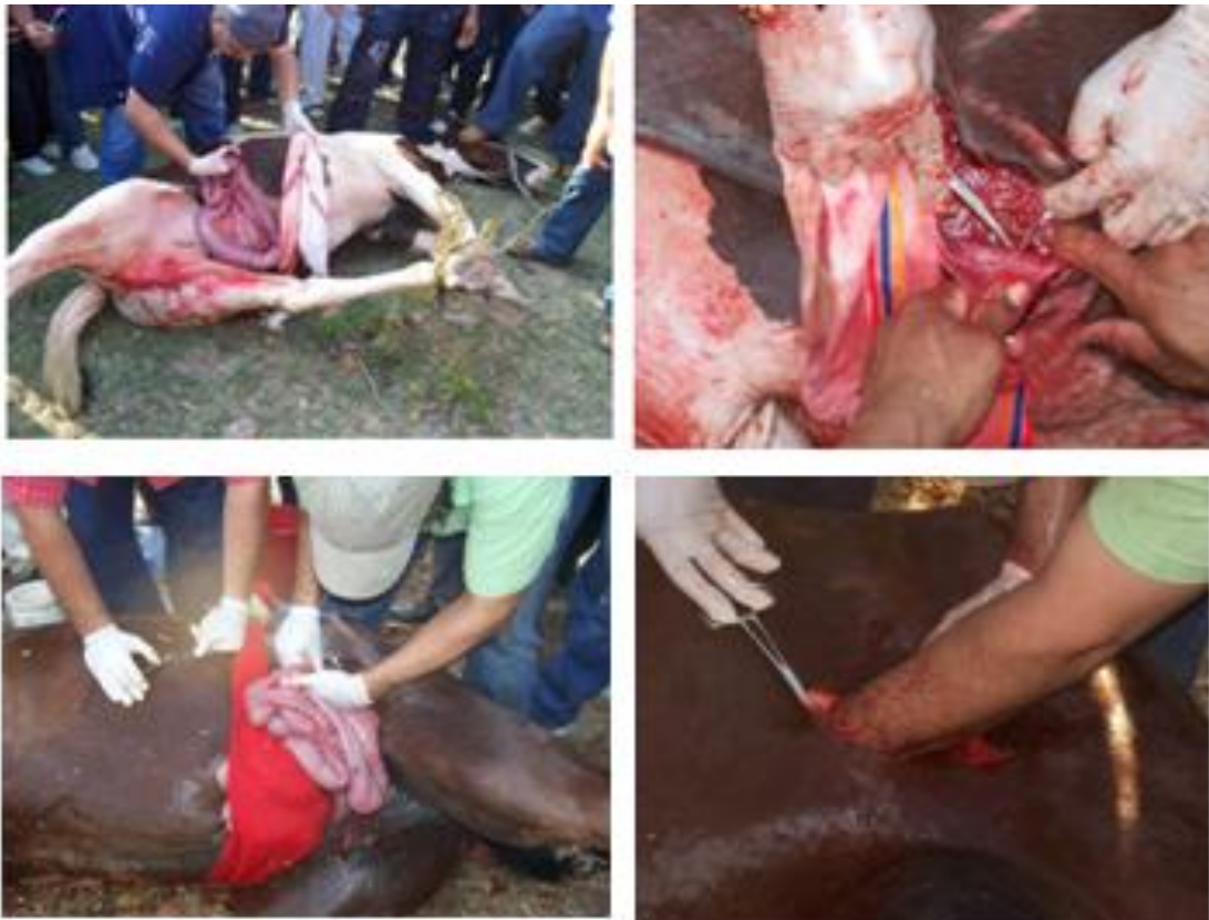
Figura 7. Quirófanos improvisados en la corraleja.