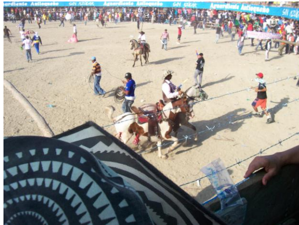
Figura 3. Caballo lesionado en la parte abdominal y miembro posterior derecho

Es pertinente analizar la manera absurda cómo algunas personas asistentes al cruel evento, pueden disfrutar cuando un toro hiere a un caballo o mucho peor cuando un mismo garrochero entra en varias oportunidades diferentes caballos y los entrega al toro para que los cornee, a veces por impericia o por imprudencia, pero la mayoría de las veces por negligencia, las cifras de caballos lesionados por toros en cada corraleja, son muy desalentadoras, tal es el caso de las corralejas de Sincelejo, Sucre, Colombia en el año 2010, en la cual resultaron 18 caballos heridos y 5 caballos muertos en la plaza (TURCIO, 2009), aun que quizás los 18 animales heridos y que fueron suturados en la corraleja, pudieron morir en sus sitios de origen. De la misma forma, en las corralejas de Coloso–Sucre, Colombia, para este mismo año, en cuatro tardes de faena resultaron heridos 17 caballos, de los cuales tres murieron mientras recibían asistencia profesional.