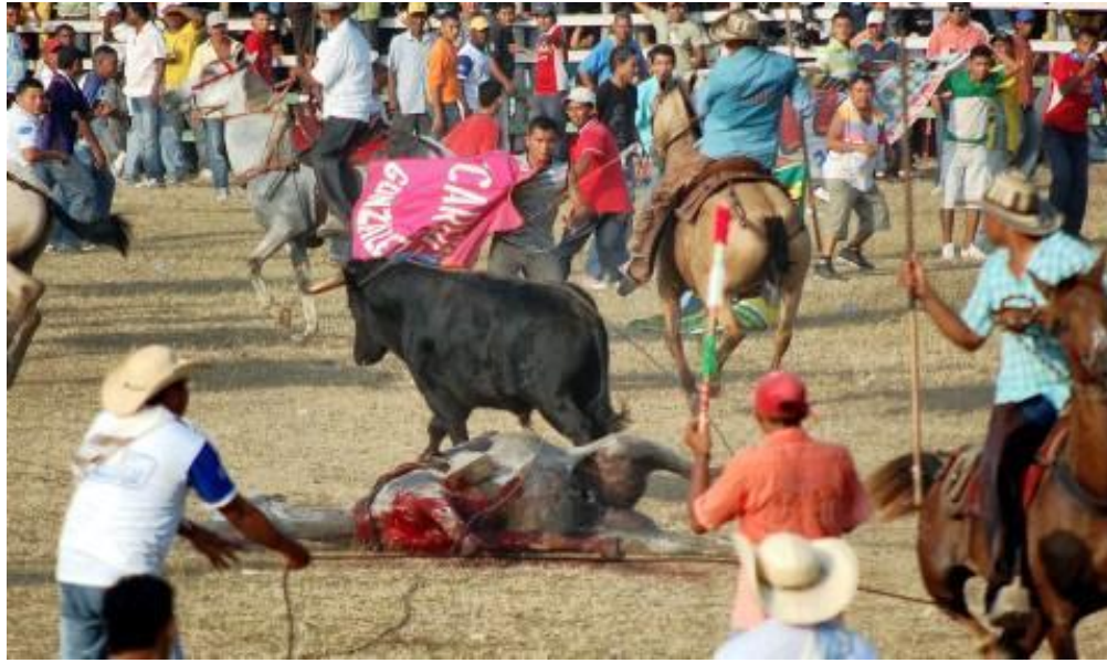
Figura 6. Caballo muerto en el ruedo de la corraleja del 20 de enero en Sincelejo, año 2010.