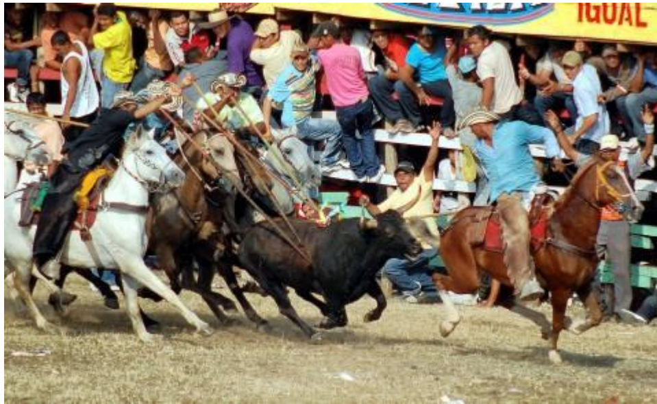
Figura 8. Garrocheros persiguiendo y picando al toro al mismo tiempo

Con acogimiento a lo señalado por SÁNCHEZ-ÁLVAREZ (2006), el torero, en este caso el garrochero, al igual que un actor, no ve, no escucha, es incapaz de percibir su actuación: la vive, la siente, la imagina incluso con fulgurante emoción. Como sujeto actuante del espectáculo le está estructuralmente vedado ser “su propio público”. Si lo intentara tendría para ello que interrumpir dicha actuación, aunque fuera de forma momentánea. Sería entonces el observador de “su no-actuación”, de su tragedia, de su fracaso. Y acaso, esto no es parte del posible pago que tributa la cabalgadura, que también forma parte integral del proceso y por su posición lleva la peor parte. Cabalgando sobre las circunstancias y por atender los requerimientos del público y amoldarse a sus exigencias, implica que ni siquiera el éxito suprime el conflicto y que el animal está inmerso en una paradoja que no puede entender, pero que con certeza lo sacrifica por nada.