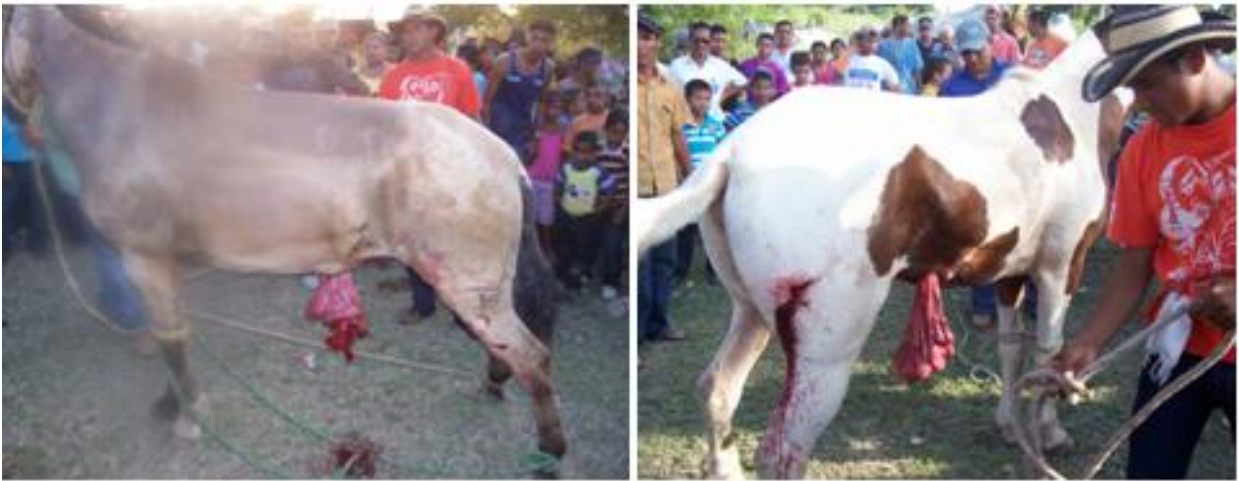
Figura 4. Lesiones perforantes en la cavidad abdominal y miembro trasero. Nótese la evisceración del intestino delgado a nivel del abdomen ventral