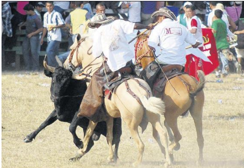
Figura 2. Embestida de un toro al caballo de garrocha, el cual se encontraba sin ningún tipo de protección