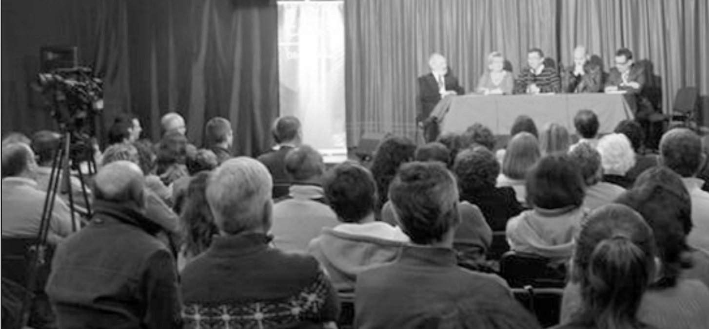
Imagen 1.-Un momento del acto de presentación del libro.