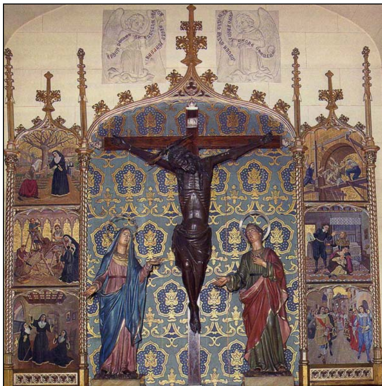
1. Palma de Mallorca, Agustinas de la Concepción. Santo Cristo del Nogal, S. XIV