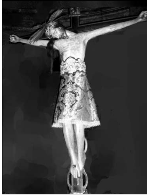
3. Palma de Mallorca, Iglesia de la Asunción-Hospital. Sto. Cristo de la Sangre, S. XVI, restaurado.