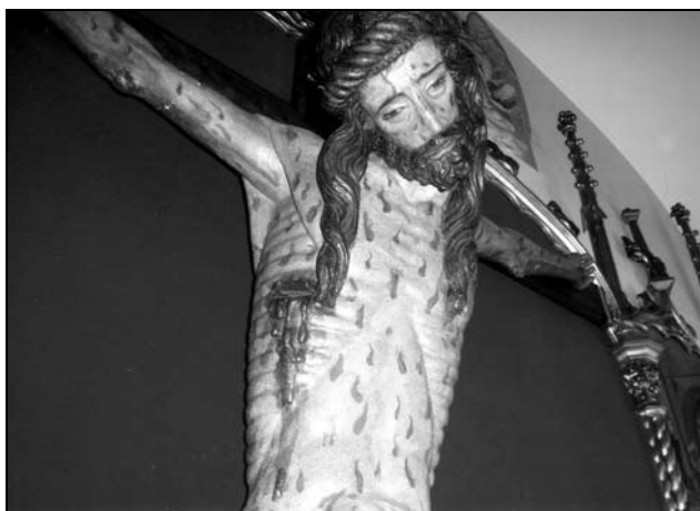
2. Detalle del Sto. Cristo del Nogal, restaurado.