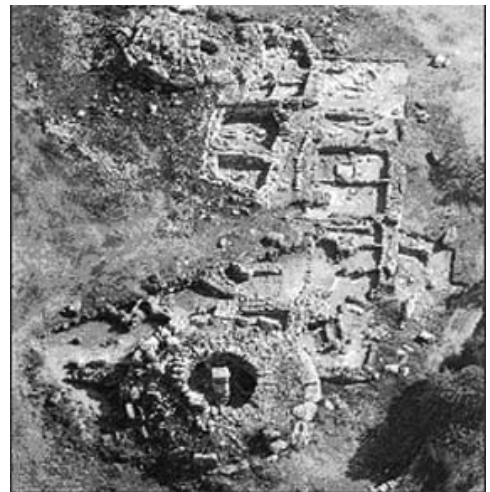
imatge 1. Poblament talaiòtic de Son Fornés. Talaiots 1 i 2 i habitatges (1 al 5). 850-550 a.n.e.

Un cop realitzades aquestes reflexions teòriques sobre què és desigualtat econòmica i com és detecta, creiem que pot ser útil analitzar un cas històric per veure amb més claredat quines eines podem emprar i de quina manera per tal d'identificar la desigualtat en una comunitat. Hem