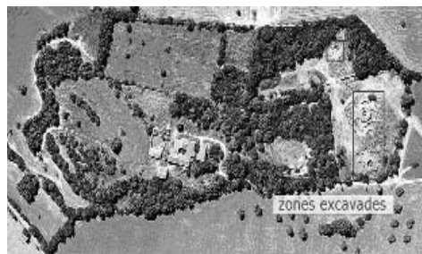
Imatge 3. El jaciment de Son Fornés (Montuiri, Mallorca)

Ens sembla molt interessant el cas dels talaiots i la murada ja que són dues construccions que impliquen organització del treball així com una gran inversió d'esforç per part de la comunitat, però són obres fetes per la comunitat (tant per l'autoria com per la utilització) en el si d'una societat igualitària (segons els paràmetres exposats més amunt). És a dir, que contràriament a l'argumentació, sovint es fa servir davant l'evidència de construccions de gran tamany així com d'obres que impliquen la mobilització d'un grup elevat de gent, requerint una organització ben gestionada de cara a garantir un resultat òptim del treball que garanteixi l'eficiència i optimització de la inversió de l'esforç de la comunitat en tasca col·lectiva, etc, no estarien dirigides per una autoritat que ordenaria a la resta del col·lectiu mitjançant mecanismes coercitius i de control la seva realització, ni tampoc tindria un ús i benefici d'aquest