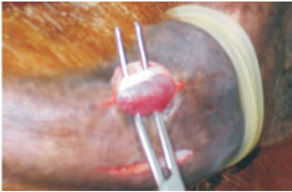
Figura 4: Debridación roma de tejido conectivo y fascia coccígea. Debridación roma de los músculos sacrococcígeos ventrales derecho e izquierdo.