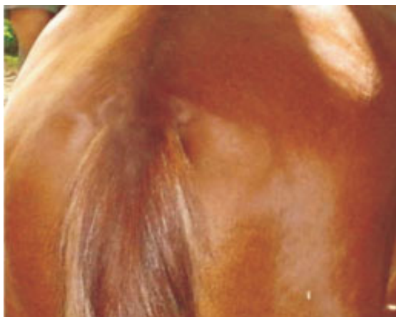
Figura 1: Evaluación caudal y lateral de la cola para determinar su dirección e implantación.

El protocolo anestésico empleado fue tranquilización con acepromacina a dosis de 1 mg/kg de peso vivo y anestesia general con guayacolato de glicerilo al 5 % más tiopental sódico a dosis de 1.1 mg/kg de peso vivo por vía endovenosa, equivalente a 2.2 ml/kg de peso vivo. En algunos casos se complemento con infiltración local de lidocaina al 2% de acuerdo con lo propuesto por Sumano y Ocampo (2). La secuencia de los pasos quirúrgicos aparecen en detalle en las figuras 1 a 6.