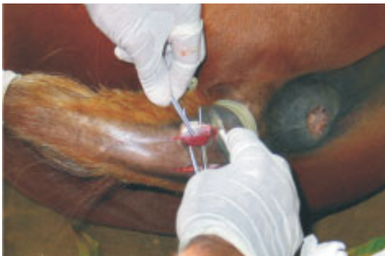
Figura 5: Escisión de 2 centímetros de los músculos sacrococcígeos ventrales derecho e izquierdo.