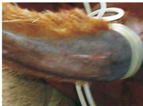
Figura 3: Colocación de un torniquete con fines hemostáticos. Por debajo del torniquete y a 8 cm desde la base de la cola (cara ventral); realización de dos incisiones paralelas, exactamente sobre los músculos sacro coccigeos ventrales derecho e izquierdo respectivamente.