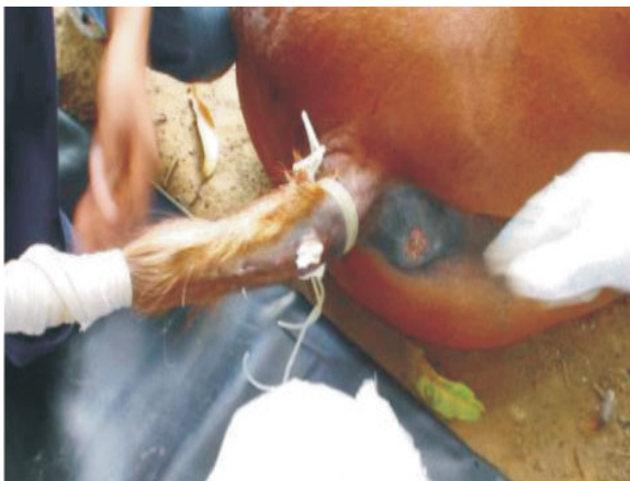
Figura 6: Obturación del espacio muerto con torundas impregnadas con percloruro de hierro para controlar la hemorragia. Estas se retiraron a las 24 horas.