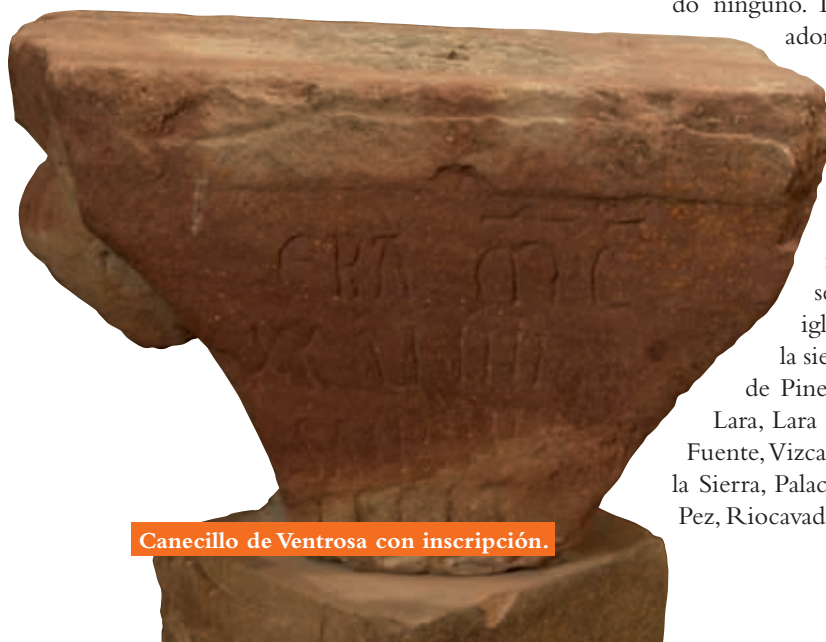
Canecillo de Ventrosa con inscripción.

adorna profusamente los elementos arquitectónicos del exterior (capiteles, cimacios, canecillos, arquivoltas, molduras...), es un ejemplo más de las múltiples degeneraciones rurales del taller de Santo Domingo de Silos: concretamente se aprecian claras relaciones con iglesias burgalesas del siglo XII de la sierra de la Demanda: tercer taller de Pineda de la Sierra, San Millán de Lara, Lara de los Infantes, Jaramillo de la Fuente, Vizcaínos de la Sierra, Hoyuelos de la Sierra, Palacios de la Sierra, Barbadillo del Pez, Riocavado, Neila y Terrazas.