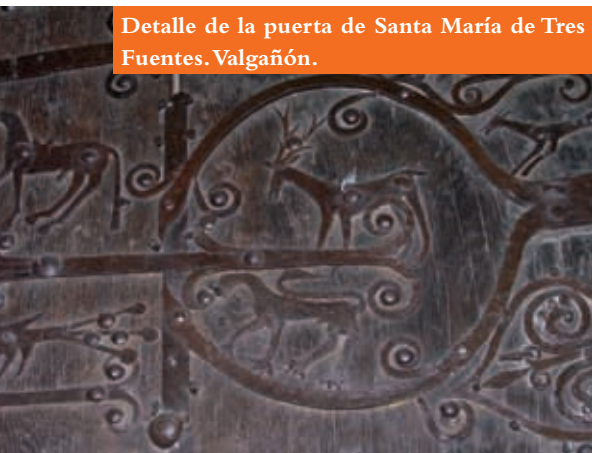
Detalle de la puerta de Santa María de Tres Fuentes. Valgañón.

Fuentes en Valgañón, San Esteban en Zorraquín, Santa María en Ledesma de la Cogolla y Santa María de la Antigua en Bañares; y rejas en las ventanas de los ábsides de San Cristóbal en Canales y Santa Catalina en Mansilla. Todos fueron realizados entre los siglos XII y XIII, ubicándose tres de ellos en la sierra de la Demanda. Los herrajes de las puertas se cubren con refuerzos de hierro decorados con diferentes motivos, fijados a la madera mediante