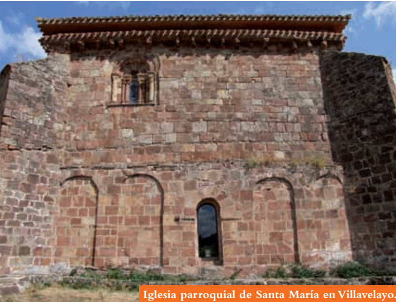
Iglesia parroquial de Santa María en Villavelayo.