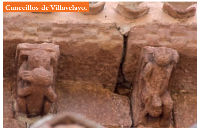
Canecillos de Villavelayo.

Pero lo que más sorprende en Villavelayo es la cantidad de canecillos (cerca de cien), que decoran su tejazoz, bordeando todo el perímetro de la construcción. Aunque los hay con motivos geométricos, vegetales y zoomórficos, abundan las cabezas, bustos y figurillas humanas desnudas en diferentes posturas, ingenuamente talladas: con los brazos pegados al cuerpo, con los brazos como si fueran orantes, sentados o haciendo sus necesidades, simulando a espinarios por su forma de doblar las