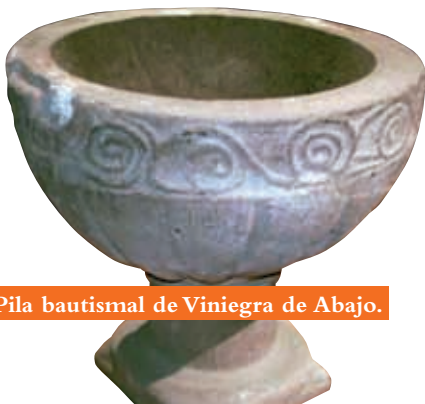
Pila bautismal de Viniegra de Abajo.

Casi todos estos templos conservan también su pila bautismal románica. Las de Ventrosa y Canales son de tipología troncocónica invertida, en forma de tina o lagar, y por su decoración de arquerías se asimilan a un taller de la zona cuyo mejor ejemplar es la pila de Cascajares de la Sierra, ya en la provincia de Burgos. Las de Villavelayo y Ledesma tienen tipología en copa o cáliz, con pie en forma de columna y taza semiesférica, y algunos de sus motivos ornamentales similares a plumaje las relacionan con otra pila burgalesa, la de San Miguel de Neila. Las fuentes bautismales de las Viniegras tienen también forma de copa, pero mientras la de Viniegra de Arriba es muy sencilla y lisa, la de Viniegra de Abajo posee una taza gallonada, avenerada o conchiforme y un friso superior decorado que la emparenta con otras piezas de los valles del Oja y del Tirón, y con las burgalesas de Eterna y Fresneda de la Sierra.