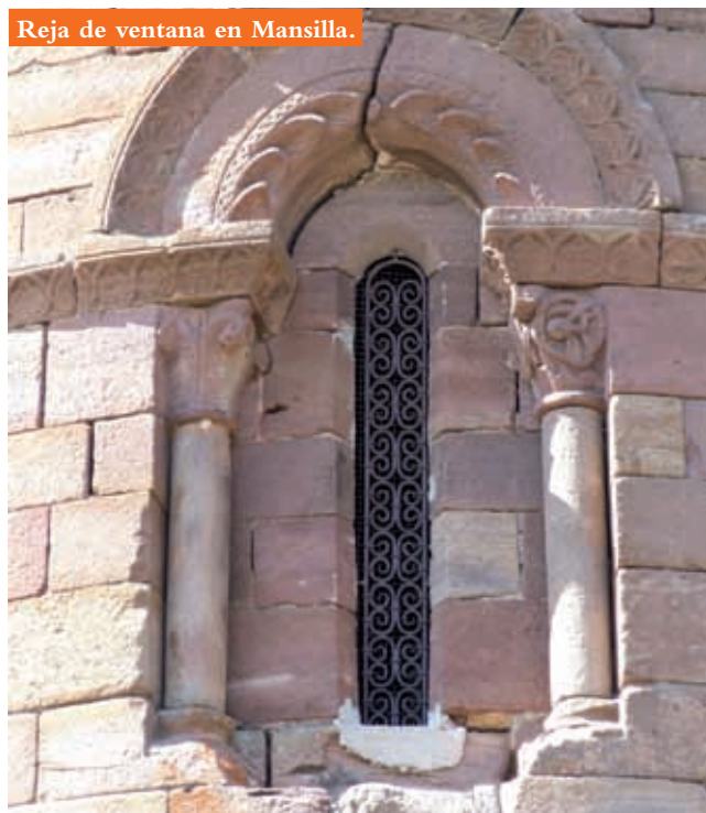
Reja de ventana en Mansilla.

grandes clavos de cabeza plana. En Zorraquín y en Ledesma son muy similares, a base de volutas enroscadas en espiral, y cambian en Bañares y Valgañón, siendo en el primer caso hojas o flores abiertas en abanico, y en el segundo, motivos astrales y zoomórficos de influencia árabe. Las saeteras de las ventanas de Canales y Mansilla adoptan la forma de roleos formando espirales.