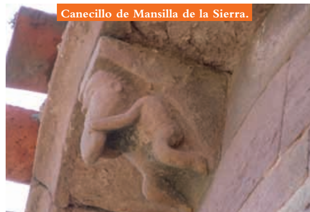
Canecillo de Mansilla de la Sierra.

Santa Catalina es una de las dos ermitas románicas con las que contaba el antiguo pueblo de Mansilla. La de San Pedro, desapareció bajo las aguas.