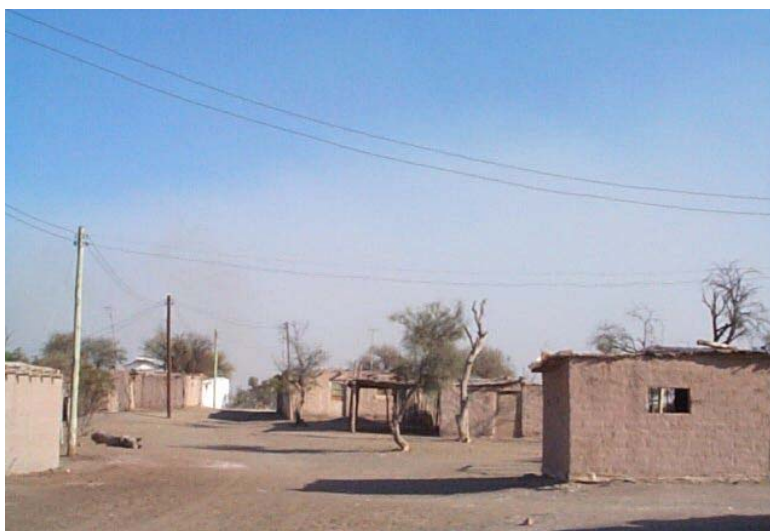
Figura 6: Paisaje de un poblado del desierto (Lagunas de Guanacache)

Desde la visión de los técnicos, al desierto se lo presenta asociado a la “zona norte” denominada Montañas y Lavalle (Turplan II, 2007: 91) -única zona cuya designación corresponde al departamento y no a una seña característica del territorio en cuestión- con una oferta articulada sobre la conjunción del oasis, los Bosques Telteca Altos Limpios y el complejo lagunero de Huanacache de Lagunas del Rosario. Se trata en cierta forma de un área de uso potencial que contendría la creación y puesta en el mercado de productos nuevos, “auténticos”, “no contaminados” en una valoración no exenta de cierta dosis de romanticismo (Figura 6).