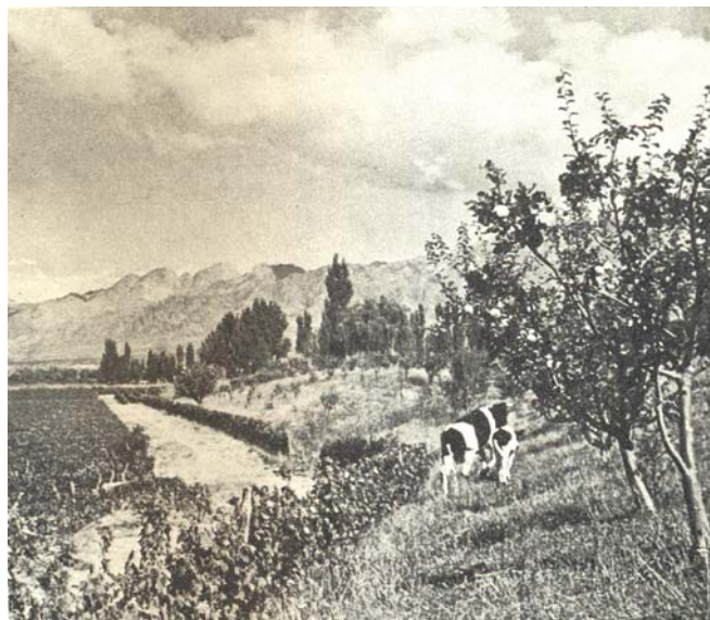
Figura 3: Paisaje

Fuente: AGPNyT, 1950. Visión de Argentina