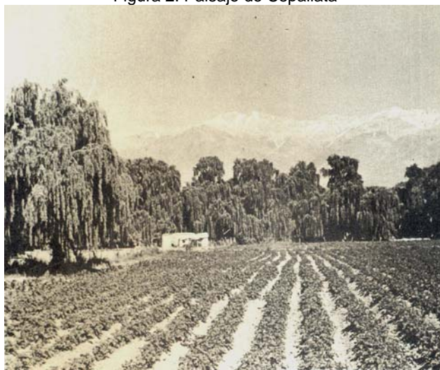
Figura 2: Paisaje de Uspallata