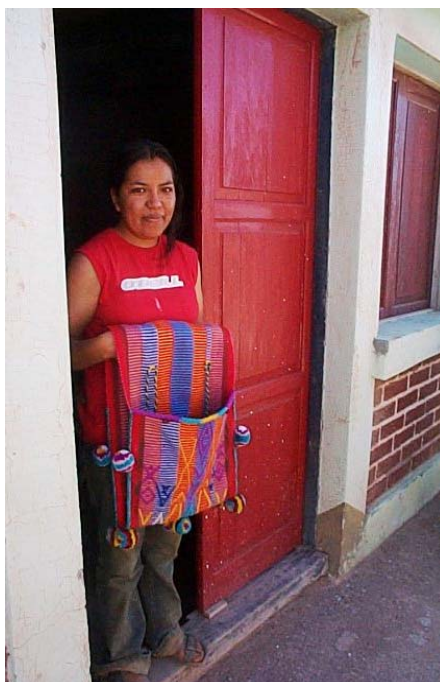
Figura 8: Artesana del desierto y su obra

Aún en este contexto, el desarrollo de algún tipo de actividad económica ligada con el turismo rompe parcialmente el patrón de estacionalidad en los ingresos de las economías domésticas sólo centradas en la venta de productos pecuarios, colaborando en cerrar las brechas entre ingresos – egresos por consumo, en los meses más críticos (verano). Además, permite que se multipliquen las oportunidades de venta para los artesanos de la zona, actividad que se ubica no en octavo sino en quinto lugar en atención a los aportes económicos que representa (Figura 8).