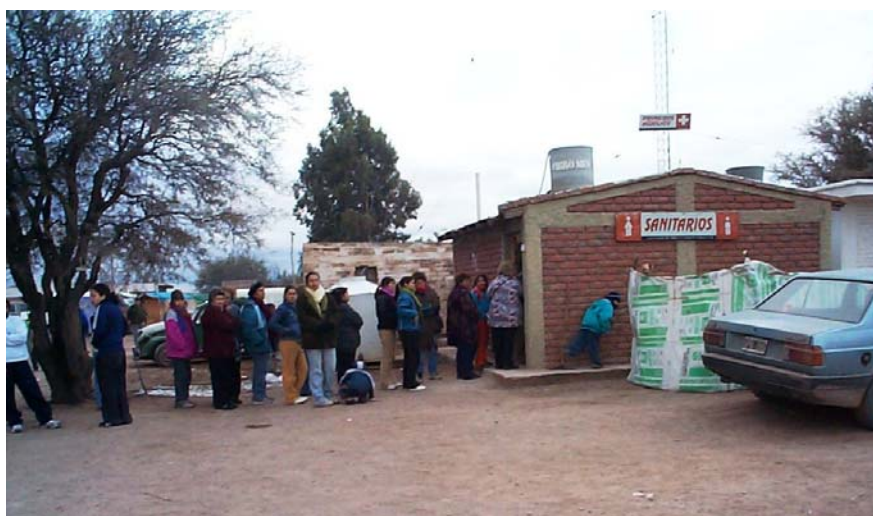
Figura 7: Disponibilidad de servicios durante una fiesta patronal

Un poco más allá de las miradas que unos y otros construyen, el desierto no parece hallarse del todo preparado para atraer y retener la demanda de turistas con sus anheladas inversiones finales. Es decir, además de lo agreste del paisaje que en todo caso podría disparar demandas de aventura y exotismo, es también agreste la infraestructura (Figura 7) dispuesta para la recepción de los visitantes y es del todo precaria la red de caminos que median las entradas y salidas.