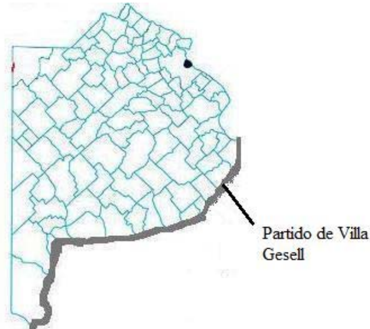
Mapa 1: Ubicación del Partido de Villa Gesell en el litoral marítimo de la Provincia de Buenos Aires

las Pampas, a pesar de sus similitudes en aspectos históricos y geoambientales, con esos espacios.