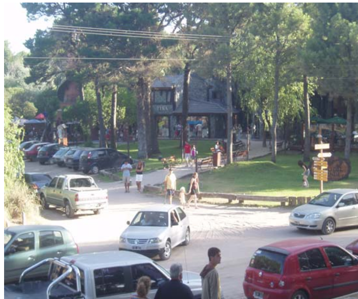
Imagen 5: Centro comerciales de Mar de las Pampas, 16 de enero de 2009

En el espacio urbano destinado a la actividad comercial sobresalen las galerías comerciales las que han crecido en número y densidad al ritmo del crecimiento de la construcción de residencias (ver Imagen 5). Algunas de ellas son paseos dedicados a la venta de artesanías producidas por grupos familiares y pequeños empresarios. Pero también se destacan los puestos comerciales de grandes marcas nacionales e internacionales que se insertan en la villa mediante el alquiler de sus concesiones para el uso de la marca a medianos y grandes empresarios de las ciudades antes nombradas. La gran mayoría de estas galerías están organizadas por pobladores locales con actores extra- territoriales.