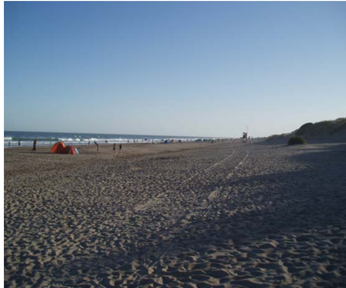
Imagen 1: Playas de Mar de las Pampas al atardecer el 15 de enero de 2010

suman los nuevos desarrollos turísticos como Mar de las Pampas y Mar Azul, al sur del Partido de Villa Gesell, de gran importancia en la actualidad (ver Imagen 1) En sus más de 1280 kilómetros de extensión y, a lo largo de 16 Unidades Político Administrativas (llamadas Partidos) también se destacan hacia el sur Claromecó y Monte Hermoso; y Santa Clara, Cariló, Mar de Ajó y San Bernardo hacia el norte.