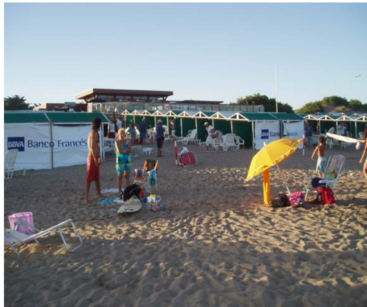
Imagen 4: Balneario soleado de Mar de las Pampas visto desde la playa pública el 14 de enero de 2010