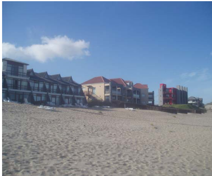
Imagen 3: En Las Gaviotas las edificaciones ya se encuentran frontales sobre la playa, 28 de enero de 2009

Pampas. La gran pendiente que poseen los médanos que separan la playa del perímetro urbano, además de generar condiciones para el neo-exclusivismo, mantienen a resguardo las variables ambientales existentes. En diversos sectores de las otras dos villas balnearias los médanos tienen una pendiente mucho más suave.