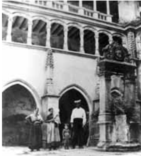
Tàrraga. Capella del Corpus Christi i Palau dels Marquesos de la Floresta (segle XIII).