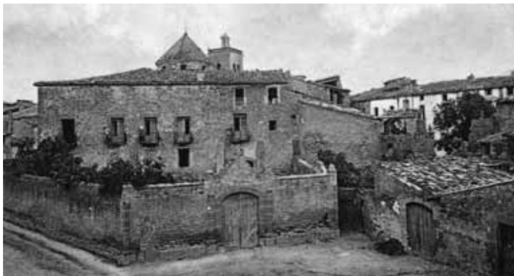
Guissona. Antic Palau Episcopal. (Claudi Cortes Busquets. HGSG).

Tot i així, hem d'assenyalar que, en ocasions, moltes de les famílies que podem identificar en les llistes podien tenir lligams patrimonials o familiars en ambdues comarques, atesa la seva proximitat geogràfica. Aquest seria el cas, per exemple, dels Bellver, família de Tàrrrega emparentada amb els Altarriba i els Çaportella de Cervera; dels Riera de Tàrrrega, que van tenir el senyoriu de la Prenyanosa durant el segle XVII; 10 dels Roger de Llúria, carlans i després marquesos de Granyena, que també tingueren residència i interessos a Cervera, Tàrrrega i algunes altres poblacions, com Anglesola; 11 etc.