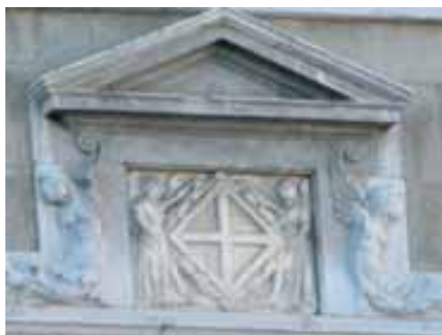
Representació dels tres diputats que van encarregar la façana actual de la Generalitat el 1597.