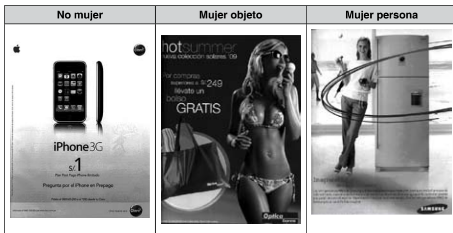
Figura 5. Anuncios de Somos: ejemplos de la categoría de mujer