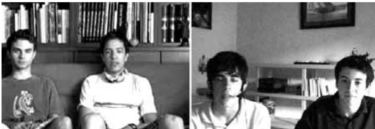
Imatge 2. Alumnus realitzant expressió oral i interactuant a través de càmera web fora de l'horari lectiu.

sam d'un ordinador connectat a un projector. Així, la pantalla on es projecta la imatge fa la funció de pissarra (de moment, no disposam de pissarres interactives). Per tant, a través de les projeccions podem fer feina amb les quatre habilitats lingüístiques: comprensió oral (escoltant un vídeo, per exemple), comprensió escrita (llegint un text projectat), expressió escrita (fent els exercicis projectats) o expressió oral (comentant, per exemple, un text o un vídeo).