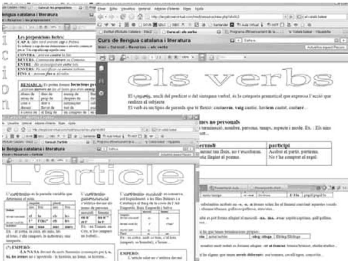
Imatge 3. Mostra de les fitxes de gramàtica.

2. Les presentacions de gramàtica. Són 24 presentacions en PowerPoint d'exercicis pràctics de les normes gramaticals. Gaudeixen de tres característiques importants que les converteixen en un mètode innovador i de gran eficàcia a l'hora de millorar la competència escrita: