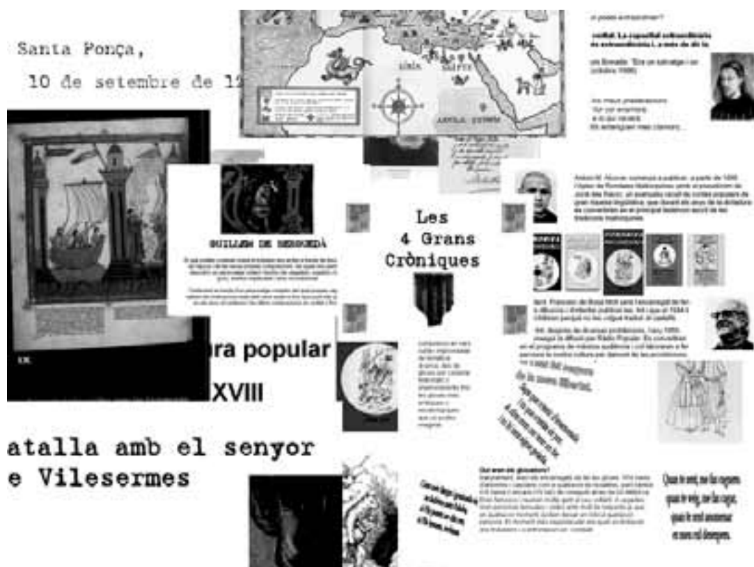
Imatge 5. Les presentacions de literatura.