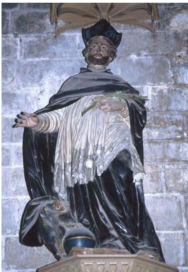
Fig. 4. Santo Domingo canónigo de Osma . Alfonso Giraldo Bergaz. Catedral. El Burgo de Osma.

A título de ejemplo, en la parte posterior de la catedral están dos grandes imágenes de Santo Domingo canónigo (fig. 4) y el descalzo San Pedro de Alcántara , realizadas por el escultor Alfonso Giraldo Bergaz (1744-1812), artista recordado por una serie de obras en Madrid, donde interviene en la fuente de Apolo o de las Cuatro Estaciones , obra de Manuel Álvarez, “el Griego”, en la que termina la figura del dios a partir de 1780, o en la cercana ciudad de Burgos, donde lleva a cabo la estatua de Carlos III erigida en su plaza mayor.