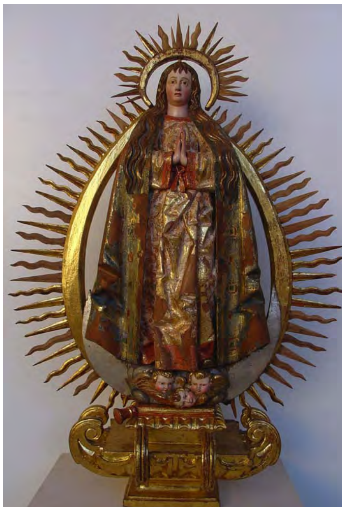
Fig. 9. Inmaculada de Palafox. Rreja del coro. Catedral. El Burgo de Osma.

Aquel buen pastor que fue Juan de Palafox dejó en Osma una gran huella y dejó testimonios artísticos (fig. 9), como su propio ajuar, ornamentos, casulla, rosario, y demás piezas litúrgicas. Pero ahora simplemente deseamos recordar que en aquel entorno de Eleta se reavivó la memoria de Palafox con referencias artísticas, como se hacía simultáneamente en Puebla de los Ángeles por el impulso de Fabián y Fuero.