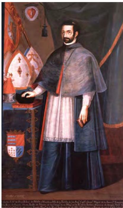
Fig. 10. Retrato de Juan de Palafox y Mendoza. Miguel Jerónimo de Zendejas. 1768.

A nivel institucional para evitar cualquier reticencia sobre la representación en la sede castellana se recurre a conseguir una copia de un retrato autorizado del siglo XVII (fig. 10), que es realizado en 1768 por Miguel Jerónimo de Zendejas (1724-1815), prolífico retratista que cuenta con otros ejemplos del prelado en Puebla.