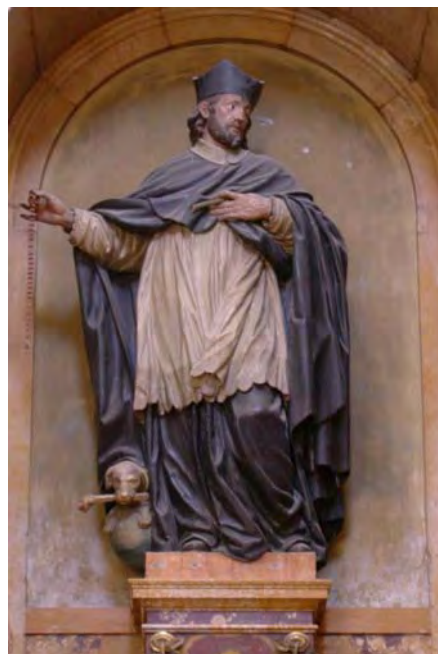
Fig. 6. Santo Domingo canónigo de Osma . Francisco Gutiérrez. Capilla Palafox. Catedral. El Burgo de Osma.

Eleta concedió al Seminario Conciliar elevadas cantidades según Loperráez 10 . Por ello no extraña ver huellas de Eleta, aparte de su escudo. En la escalera principal del edificio está un hermoso lienzo con Santo Domingo Canónigo de Osma , firmado por Ángel Bueno y datado en 1791. Este mismo pintor dejó otros dos lienzos al año siguiente, en los que está más evidente la huella póstuma de Eleta, pues están dedicados a San Pedro de Alcántara y a San José , el titular de su provincia religiosa.