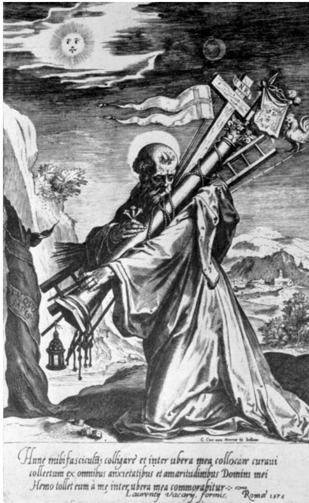
Fig. 8. San Bernardo abrazando los Arma Christi. Paolo de Franceschi, grabado por Cornelio Cort. 1576.

modo con Palafox, pues se vio inmerso en las tensiones del regalismo, el reformismo ilustrado y su propia postura episcopalista, coincidiendo con las tensiones frente a las órdenes religiosas, excepto -también él- con los carmelitas y los descalzos alcantarinos. Del cuidado por la imagen de Palafox recordamos que Fabián y Fuero legó a la posteridad dos aspectos importantes para la memoria de Palafox, un edificio para la Biblioteca Palafoxiana y la reedificación de la iglesia de San José de Chiapa, en la que se escondiera el venerable de las persecuciones.