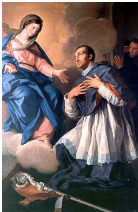
Fig. 11. La Inmaculada de Cosamaloapan irradiando luz de sus manos a las del venerable Palafox . Hacia 1780. Catedral. El Burgo de Osma.