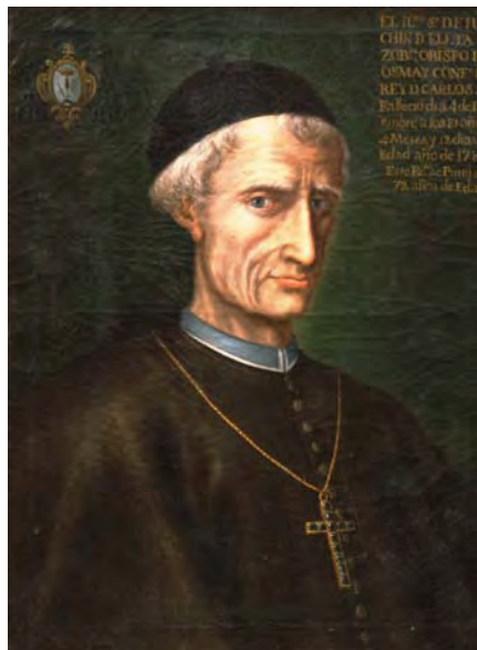
Fig. 3. Retrato de Eleta . Manuel de Torrijos. Santuario de San Pedro de Alcántara. Arenas de San Pedro (Ávila)

Un retrato de Eleta (fig. 3) bastante parecido se encuentra ahora en el Museo del Santuario Real de San Pedro de Alcántara, en Arenas de San Pedro, pintado por el religioso descalzo Hermano Manuel de Torrijos, que nos parece copia del lienzo de Beratón. Una curiosa anotación en tinta, sobre el bastidor del lienzo, indica que “Lo saco el H no . Manuel de Torrijos”, expresión que parece indicar sea traslado o copia de un modelo 8 .