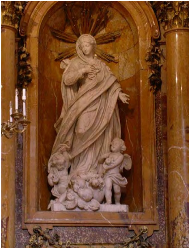
Fig. 7. Inmaculada Concepción . Roberto Michel. Capilla Palafox. Catedral. El Burgo de Osma.

Así, en tal ambiente, se produce la dedicación de la capilla de la catedral de El Burgo de Osma a la Inmaculada, devoción tan ligada al descalzo Eleta, y desde el punto de vista individual el propio fraile había elegido como Patrona y Protectora a la Virgen de la Purísima Concepción en su profesión religiosa.