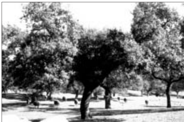
Fig. 5. Dehesa en funcionamiento.

grandes propiedades en manos foráneas, lo que sin duda constituye una prueba más del diagnóstico general que efectuamos de esta sierra, como espacio colonial a la sombra de la campiña y la capital.