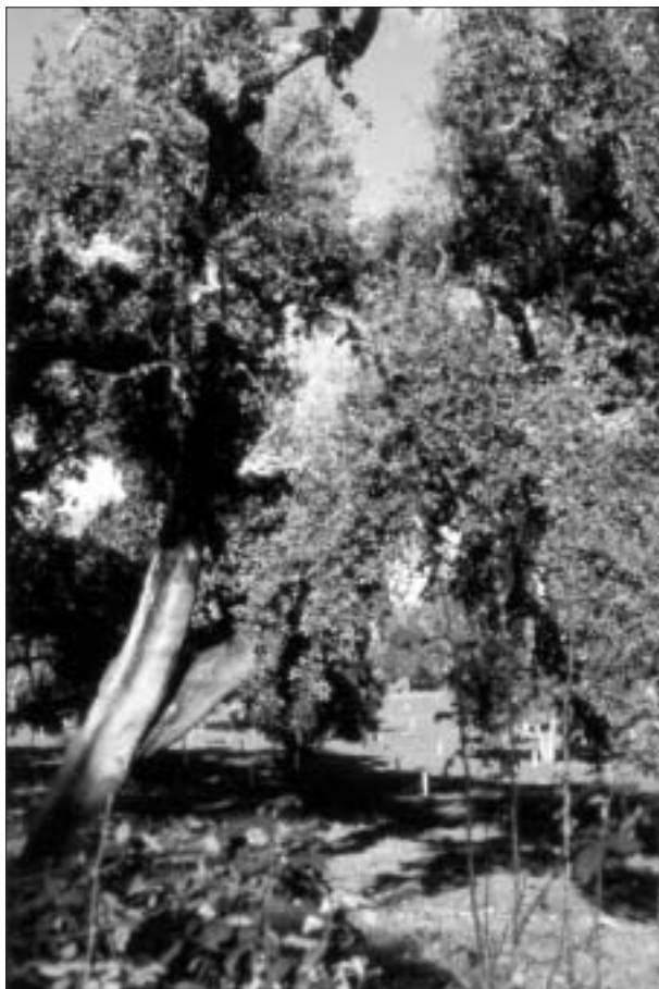
FIG. 7. Programa europeo de reforestación: densificación de las dehesas.

Todas aquellas circunstancias, unidas a los defectos constructivos propios de la especulación inmobiliaria, encuadrada en la llamada «cultura del pelotazo» (en torno a la exposición del 92), condujeron a un cierre de la villa turística cazallera casi inmediato a su inauguración. No obstante, las crecientes expectativas asociadas al desarrollo del turismo han provocado su reciente nueva apertura.