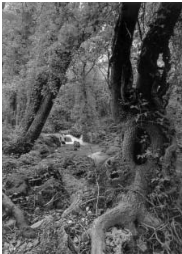
FIG. 6. La riberá del Huéznar, eje turístico de la comarca.

Ya desde finales de los ochenta aparecen unos factores que contribuyen a la dinamización de las actividades de ocio: Los Programas de Desarrollo Integrado de Turismo Rural (PRODINTUR), iniciados en 1987, la declaración por ley del Parque Natural, en 1989, y las programaciones y desarrollos de los dos proyectos europeos Leader implantados en la comarca (1991 y 1995). Las infraestructuras viarias se han transformado, mejorando sensiblemente los accesos a la sierra y las comunicaciones internas, y los equipamientos hoteleros se han multiplicado y diversificado, hasta el punto de que Cazalla de la Sierra, por ejemplo, es uno de los municipios andaluces que más ha incrementado su oferta