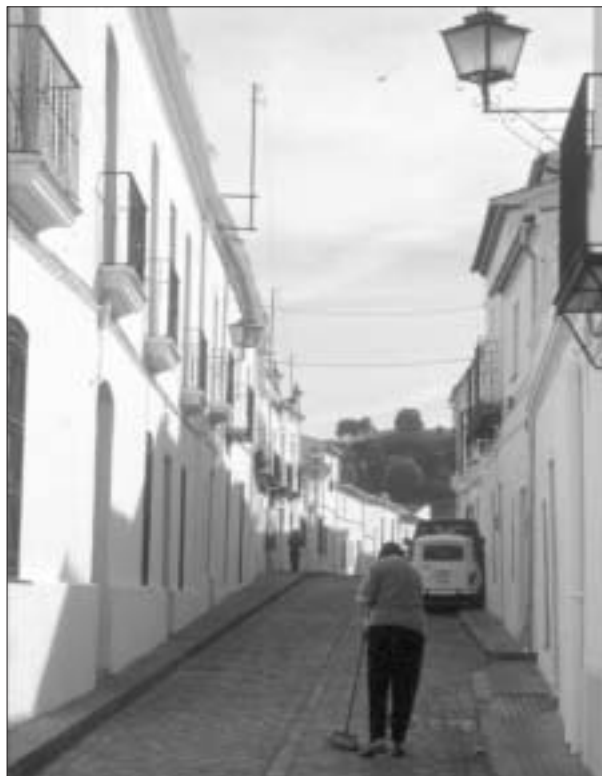
FIG. 3. Calle serrana.

Serán pues la continua sumisión a coyunturas históricas y la recurrente adaptación a imperativos foráneos, los rasgos más definidores de este territorio que no acaba de encontrar una vía estructural de desarrollo. Tal carácter ha ido dejando unas huellas tanto en sus usos y aprovechamientos, que han caminado hacia una mayor homogeneización, como en su estructura de apropiación,