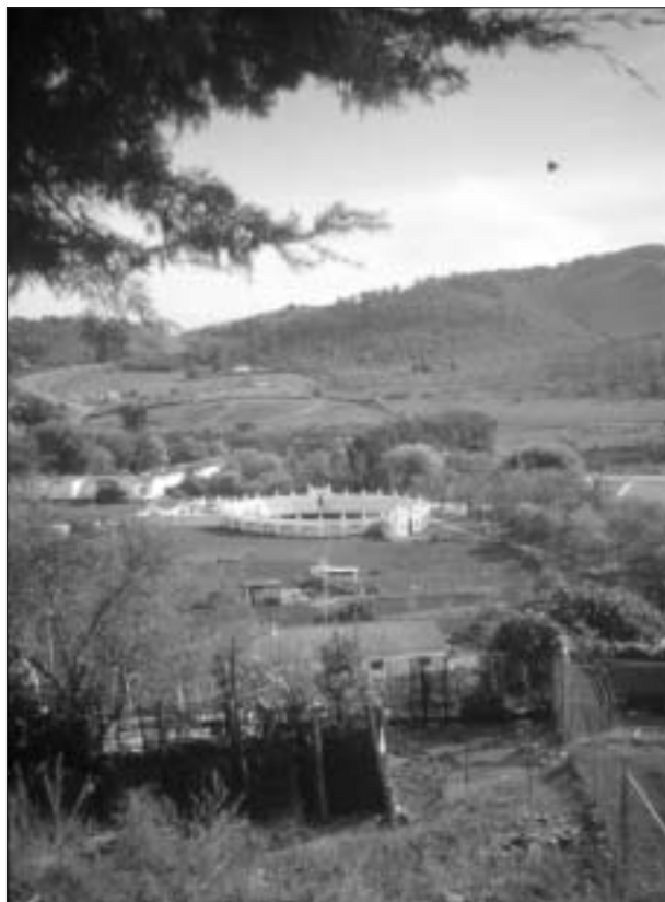
FIG. 4. Cortinales y ruedos de Cazalla de la Sierra.

vo para la molturación del aceite. La mayor parte de los municipios cuentan con almazaras cooperativas y algunos de ellos disponen también de envasadoras privadas, constituyendo ésta una de las pocas actividades industriales que han resistido la crisis. A su relevancia paisajística hay, pues, que sumar su importancia social, ya que ha constituido una estrategia de conformación y desarrollo de un colectivo agrícola autóctono, muy representativo de ciertas poblaciones como Constantina o Guadalcanal, que tiende a equilibrar el mercado dualismo social, ya que se sitúa en los escalones intermedios de la estructura de apropiación de la tierra. Precisamente por ello las subvenciones a la molturación del aceite constituyen unas de las ayudas con mayor reversibilidad social y territorial en esta sierra.