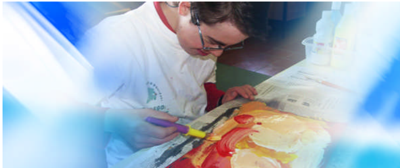
A experimentación coas pinturas e obxectos abríronlle un mundo de posibilidades expresivas

O alumno participou cun aceptable nivel de autonomía na procura de información en xornais e páxinas web. Para el, foi un importante reforzo sentir que podía levar a cabo as tarefas sen a constante supervisión da mestra. Nos traballos que requirían comunicarse cos outros, precisou axuda. Falamos dun neno pouco falador, que apenas fai preguntas e que diante do teléfono queda case mudo. O relevante é que entendeu o proceso de busca como un labor previo á saída, e que se sentiu verdadeiro protagonista da experiencia.