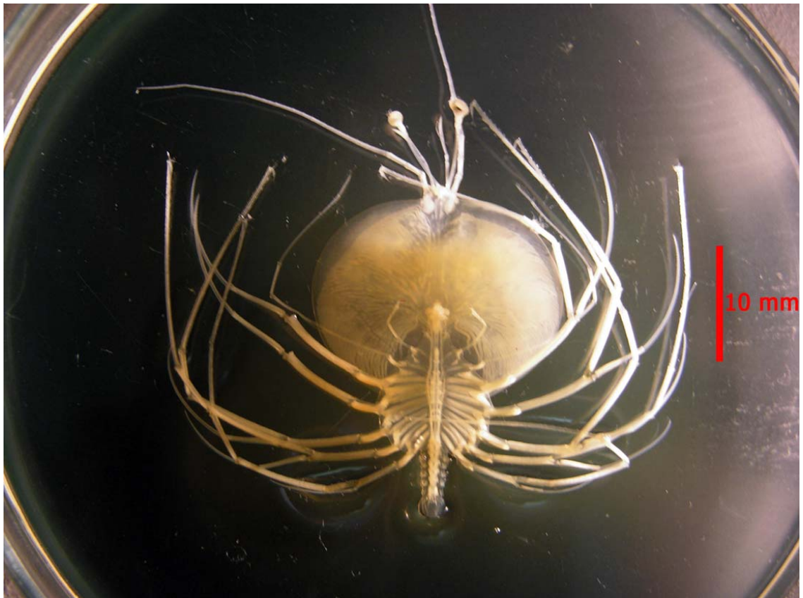
Figura 2. Vista ventral de phyllosoma XII o XIII de Jasus frontalis / Ventral view of phyllosoma XII or XIII of Jasus frontalis

De acuerdo a lo anterior y a los antecedentes disponibles (Gurney 1936, Johnson 1971, Báez 1973, 1983, Ito & Lucas 1990, Dupré & Guisado 1996, Kittaka et al. 1997, Coutures 2001, Rivera & Mujica 2004), se postula que el phyllosoma capturado frente a bahía Salado, corresponde a un estado XII o XIII de Jasus frontalis , que difiere de las descripciones de otros estadios, por la longitud de las antenas y el borde posterior de cefalon, que no es levemente aguzado.