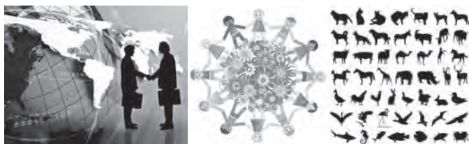
Figura 2. Percepción individualista, homocentrista y biocentrista.

De igual manera existe quien lo percibe como un pedazo de tierra que puede ser vendido o conquistado; otros lo perciben de manera más amplia como un planeta en el cual habitan los seres humanos, pero otros más lo perciben como un planeta que además de contener a la humanidad contiene en él la vida de millones de animales (Fig. 2).