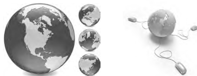
Figura 1. Visión monofocal

Esto puede ser entendido de un modo más simple a través de las imágenes presentadas en la figura 1.