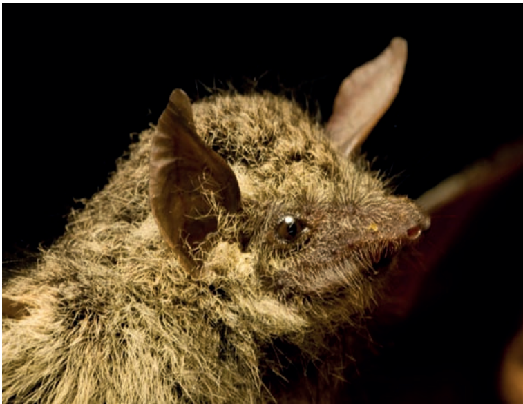
Figura 4. Molossus ater