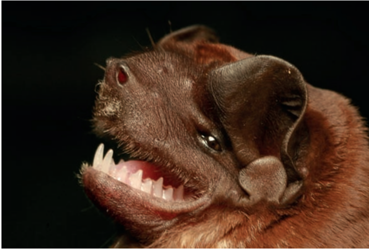
Figura 1. Vampyrum spectrum