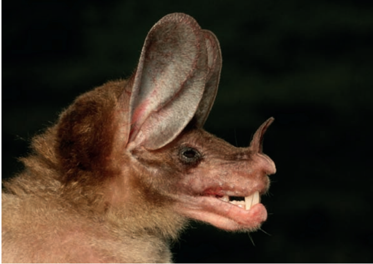
Figura 3. Rynchonycteris naso