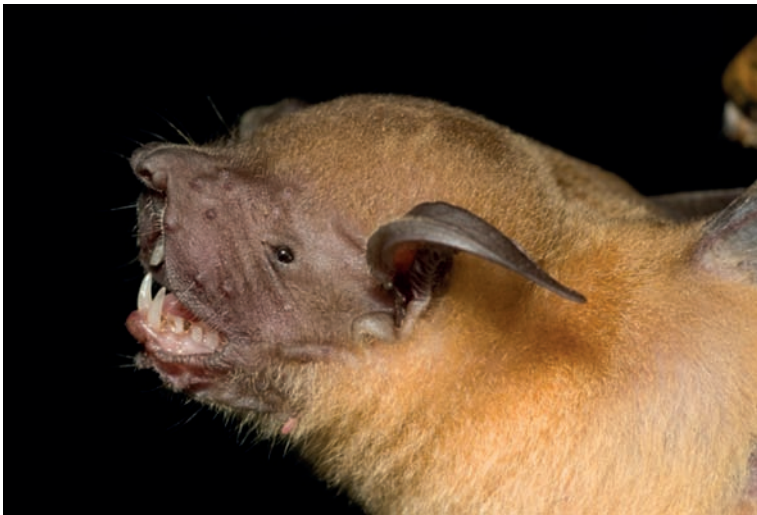
Figura 2. Noctilio albiventris