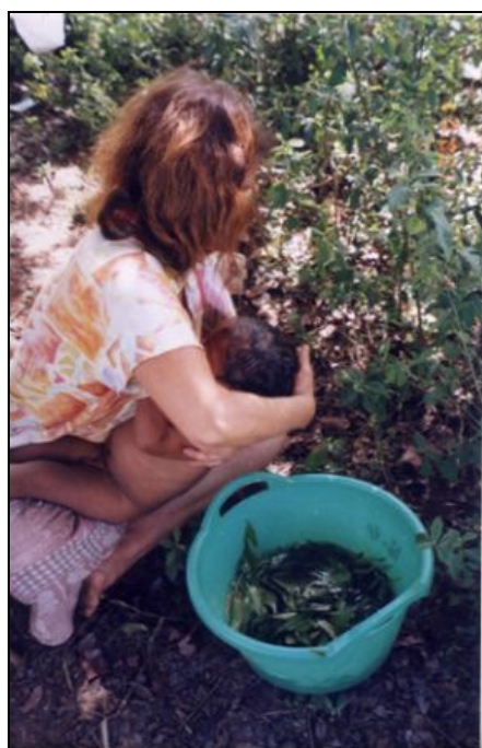
Figura 4: Kuña Karai curando a su nieto con plantas medicinales

padres es indispensable poseer algún conocimiento acerca de las enfermedades que “ agarran ” frecuentemente a los niños y de los recursos más eficaces para tratarlas. En general son las madres quienes perciben y detallan una amplia gama de síntomas y eventuales causas que conducen a un diagnóstico presuntivo o más firme. Y suelen ser los padres del niño quienes intervienen más activamente en la búsqueda del recurso terapéutico, en especial si éste se encuentra en sectores alejados de las viviendas o en el monte. La intervención de uno u otro en la búsqueda y administración de los remedios depende del tipo de enfermedad que padece el niño y de la trayectoria y experiencia previa del adulto, tanto en relación a sus conocimientos sobre las enfermedades, como en el manejo de los “ yuyos ” u otros tipos de recursos terapéuticos (SY, 2007).