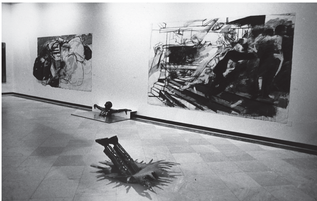
Fig. 4: fotografía de pinturas de José Balmes y esculturas de Juan Egenau en Chile Vive .