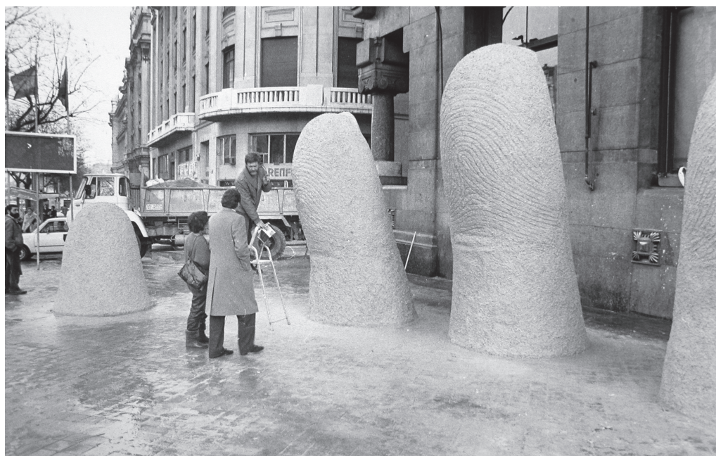
Fig. 7: fotografía de Mario Irarrázabal instalando su escultura Mano en la acera de la calle de Alcalá, frontis del Círculo de Bellas Artes de Madrid.