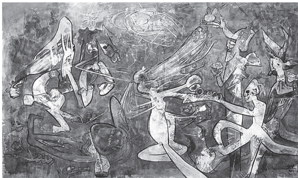
Fig. 3: Matta, Roberto (1986), Munda y Desnuda: la libertad contra la opresión , óleo sobre lienzo, 2,5 por 4 metros.