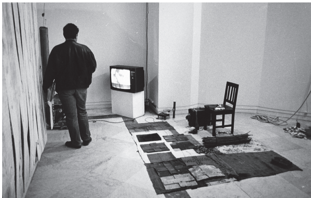
Fig. 6: fotografía de un fragmento de la instalación self-portrait de Carlos Leppe (1987) en Chile Vive .