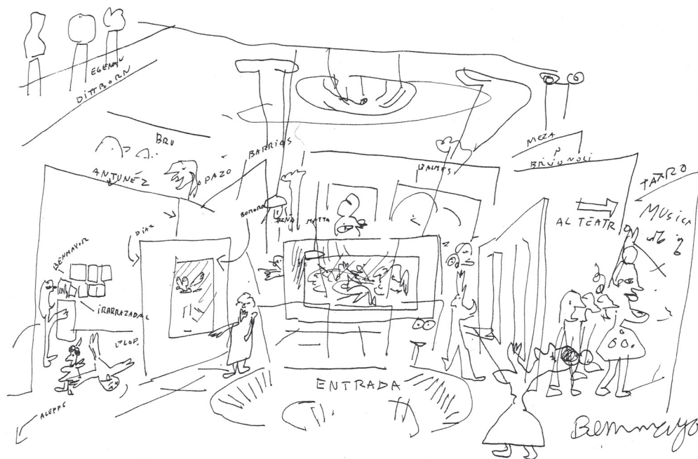
Fig. 2: Benmayor, Samy (1987), dibujo de de la distribución de la sala de artes plásticas de Chile Vive.