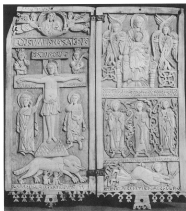
Fig. VI. Díptico de la Abadía de Rambona (Italia). Siglo X. Museo Cristiano (Vaticano). A los pies de la Loba aparece la inscripción: 'Romulus et Remulus a Lupa Nutriti'.

La inscripción de por sí no tiene ninguna connotación negativa, pero puede establecer una comparación iconográfica entre quienes se alimentaron de la cultura de Roma y quienes se alimentan simbólicamente del Cuerpo de Cristo.