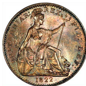
Fig. II. Cuarto de penique de Jorge III. Inglaterra, 1822.

La propia moneda romana se sirvió de la imagen de la Dea Roma con fines patrióticos, como podemos observar en un Antoniniano de Filipo II, acuñado en Antioquía ( Fig. III ), un ejemplo entre los muchos existentes, en el que podemos observar cómo el modelo fue difundido por todo el Imperio, y de qué modo las ciudades lo emplearon para demostrar su adhesión y sometimiento, no sólo a un sistema de gobierno, sino a una ciudad que era también una entidad sagrada.