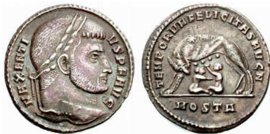
Fig. V. Moneda acuñada bajo el gobierno de Majencio en la ceca de Roma, en cuyo reverso aparece la Loba Capitolina amamantando a Rómulo y Remo. Este es el modelo que pudo tomar Antonio del Pollaiuolo para la realización de las dos figuras cinquecentistas de Rómulo y Remo, tal y como las conocemos hoy.

La Loba Capitolina está también presente en el ideario popular sobre la ciudad de Roma, y aún más que la propia representación de la Dea , la Loba se ha convertido en su símbolo más extendido. Su representación más célebre, aquella escultura de bronce aún conservada en el Palacio de los Conservadores del Capitolio, y que supuestamente adornó el Senado de Roma, no era una obra romana ni etrusca, sino producto de una fundición medieval 23 . El mito fundacional de Roma la colocaba como Lupa Nutrix o Mater Nutritia de la ciudadanía, pues la Loba había alimentado a los fundadores de la ciudad, que eran la representación de toda su población. Una de las claves para entender su pervivencia fue, por un lado su originalidad iconográfica, y por otro, la enorme difusión que este modelo alcanzó en todo tipo de soportes durante el período imperial, desde monedas ( Fig. V ), estandartes militares, escultura exenta y multitud de relieves que decoraban espacios públicos en las capitales provinciales 24 .