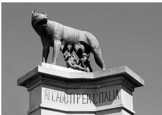
Fig. VII. Loba Capitolina en un monumento dedicado a los caídos por Italia, levantado bajo el gobierno de Mussolini en la ciudad de Roma.

Otro de los capítulos reseñables en la recuperación de la iconografía lupercal tuvo lugar en el siglo XX, bajo el gobierno de Benito Mussolini que, no sólo hizo limpiar el área forense de Roma con objeto de recobrar la imagen imperial de la Urbs 26 , sino que además ordenó la reproducción en bronce de un gran número de copias, tanto de la Loba Capitolina como de la escultura de Augusto de Prima porta , que fueron ofrecidas como regalo diplomático a las ciudades extranjeras que mantenían algún lazo, bien histórico, o bien onomástico, con Roma -como son los casos de Mérida y Zaragoza-. Asimismo, durante el gobierno fascista, la Loba Capitolina fue un tipo iconográfico frecuentemente empleado en los monumentos dedicados a los caídos por Italia ( Fig. VII ).