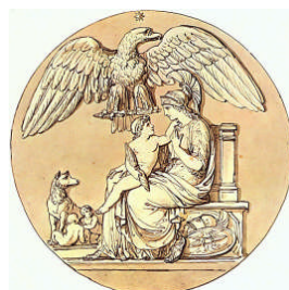
Fig. III. Antoniniano Filipo con la leyenda ROMAE AETERNAE en el reverso. Ceca de Antioquía de Siria.

Un caso paradigmático de recuperación de la iconografía de Roma en época contemporánea, es la creación del título de ' Re di Roma ', esto es, de Rey de Roma por parte del Senado-Consulta de la ciudad en febrero de 1810 para Napoleón II. Una representación alegórica de Bartolomeo Pinelli pin-