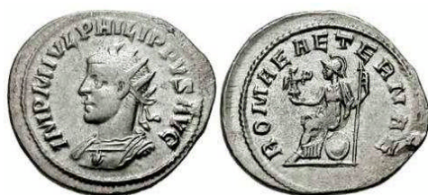
Fig. III. Antoniniano Filipo con la leyenda ROMAE AETERNAE en el reverso. Ceca de Antioquía de Siria.

La propia moneda romana se sirvió de la imagen de la Dea Roma con fines patrióticos, como podemos observar en un Antoniniano de Filipo II, acuñado en Antioquía ( Fig. III ), un ejemplo entre los muchos existentes, en el que podemos observar cómo el modelo fue difundido por todo el Imperio, y de qué modo las ciudades lo emplearon para demostrar su adhesión y sometimiento, no sólo a un sistema de gobierno, sino a una ciudad que era también una entidad sagrada.