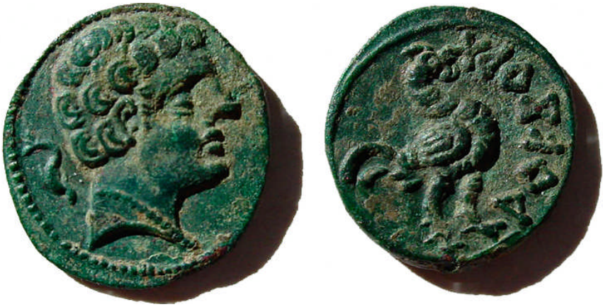
Fig. II. Semis de Arekoratas.