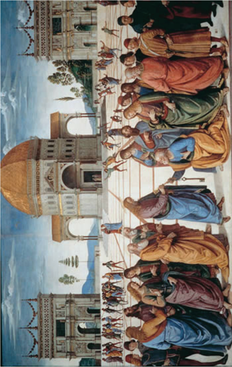
Figura 1. Pietro Perugino, La entrega de las llaves