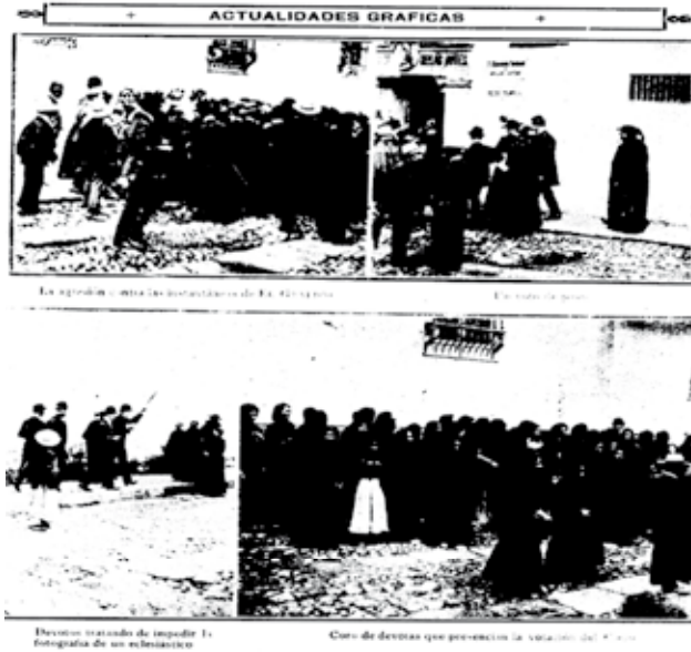
Día de votación.

Al analizar las fotografías publicadas por El Gráfico , entre el 24 de julio de 1910 y 1911, encontramos que en total fueron 483. Nos damos cuenta que el tema de mayor recurrencia en el semanario fue internacional que suman un total de 110. En su mayoría se trataban de fotografías de la realeza europea, de África, Asia y Oceanía. Las fotografías muestran el interés de los países europeos por conocer sus colonias a principios del siglo XX. En últimas estas resaltaban los intereses de los países de origen de los fotógrafos que las tomaban. Como vemos, la fotografía en ese sentido obedecía a los intereses de producción de estas y no a los intereses de los lectores colombianos.