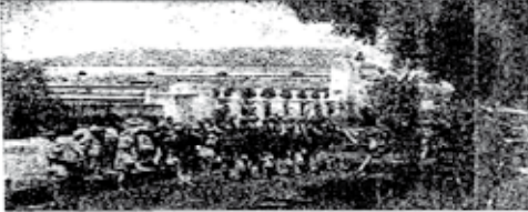
Barranquilla - Manifestación en Palonegro al conmemorar la independencia que celebra los restos de los combatientes en Palonegro.

Los discursos cuyo franco desarrollo termina en