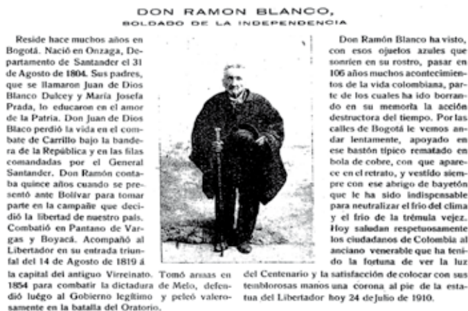
Ultimo soldado de la independencia