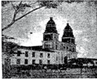
Barranquilla - Catedral de San Laureano