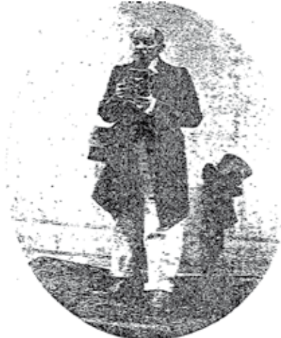
EL PROFESOR PERDIGONES, fotógrafo de capritina, licame, sujetador de vivoras, etc.