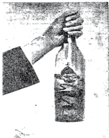
El duende fotógrafo, embotellado