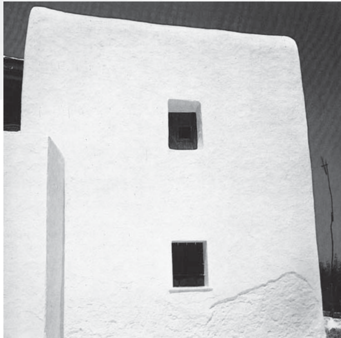
Casa en Ibiza. Fotografía: Joaquim Gomis. En: Ibiza: fuerte y luminosa, strong and luminous, forte et lumineuse, kraftvoll und strahlend