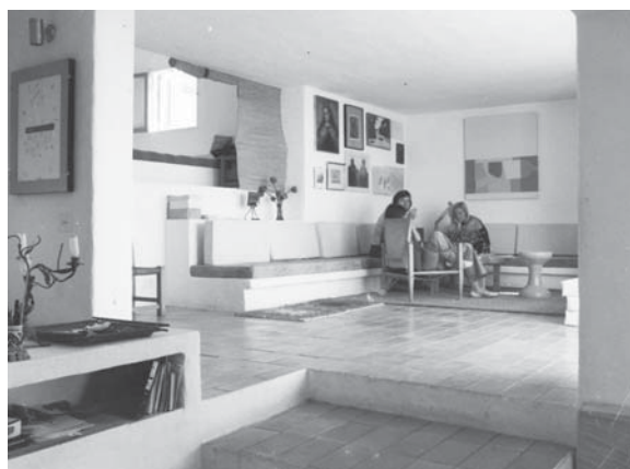
Casa Gutiérrez. Dormitorio y sala de estar.