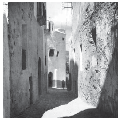
Dalí Vila, calle. Fotografía: Joaquim Gomis. En: Ibiza: fuerte y luminosa, strong and luminous, forte et lumineuse, kraftvoll und strahlend

* Arquitecta, Universidad de los Andes. Maestría en Restauración de Monumentos Arquitectónicos, Universidad de La Sapienza, Roma. Profesora de cátedra, Departamento de Arquitectura, Universidad de los Andes.