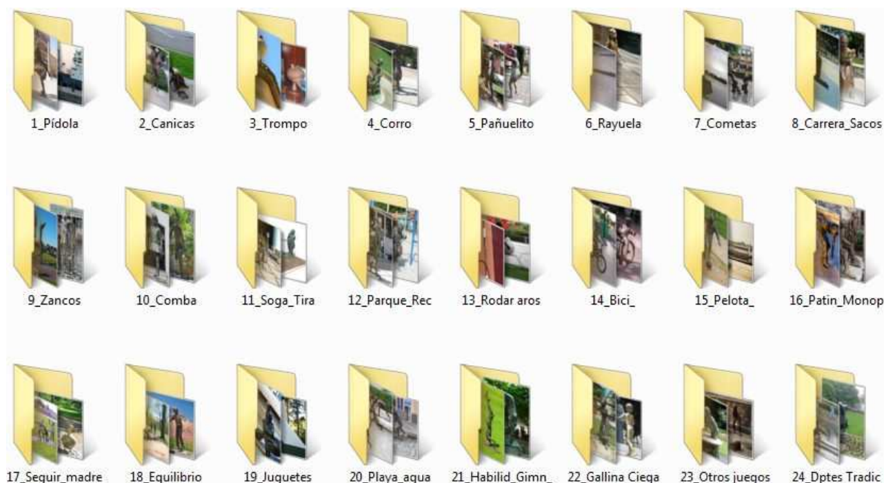
Juegos Tradicionales en la escultura

A continuación, con el objetivo de hacer lo más operativa la investigación hemos clasificado las diferentes esculturas donde han quedado inmortalizados algunos juegos populares objeto de nuestro estudio y que detallamos en las siguientes carpetas: