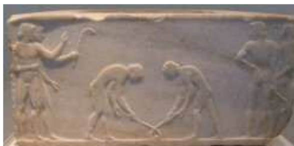
Relieve en mármol. Museo Arqueológico de Atenas

En el terreno puramente deportivo, la escultura griega y romana nos ofrecen numerosas representaciones artísticas en diferentes formatos y soportes. Destacamos la que se encuentra en el museo arqueológico de Atenas, donde se muestra a dos jugadores de hockey y la figura del Discóbolo de Mirón.