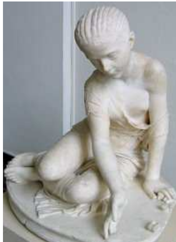
Escultura de una niña jugando a Tabas, año 130 - 150 d.C. Berlin, Antikenmuseum