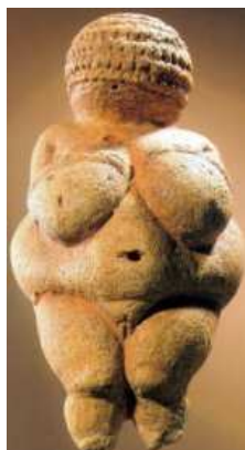
Venus de Willendorf. Museo de Historia Natural. Viena

La escultura tuvo en su principio un único sentido, es decir su uso inmediato; posteriormente se añadió una función ritual, mágica, funeraria y religiosa. Esta funcionalidad fue cambiando con la evolución histórica, adquiriendo una principalmente estética o simplemente ornamental y llegando a ser un elemento duradero o efímero. (Sureda, 1988). En la antigüedad la escultura cumplía una función didáctica o pedagógica y se utilizaba como recurso, para intentar explicar al pueblo algunos acontecimientos o conceptos. Así, en la prehistoria queda representada mediante la Venus de Willendorf la idea de la fecundidad y en la Edad Media , en la época del arte románico , encontramos en la entrada de algunas iglesias y catedrales verdaderos “catecismos pétreos” o “Biblia en piedra”, con la intención de ilustrar a la población analfabeta.