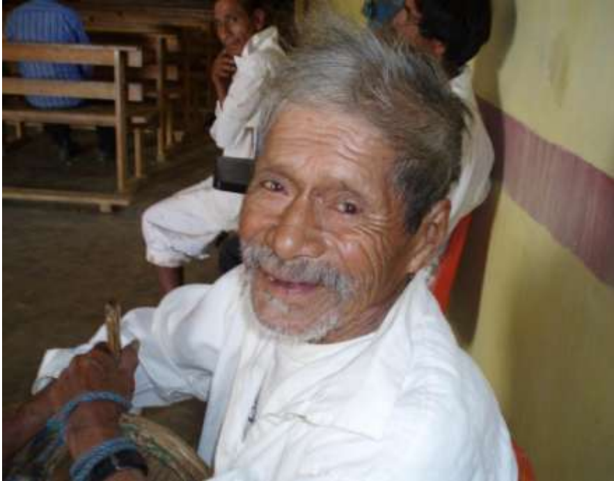
Imagen 2. Anciano indígena de 97 años (†).