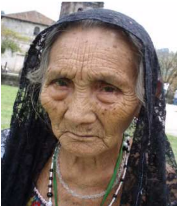
Fotografía de L. Reyes Gómez, 2007.