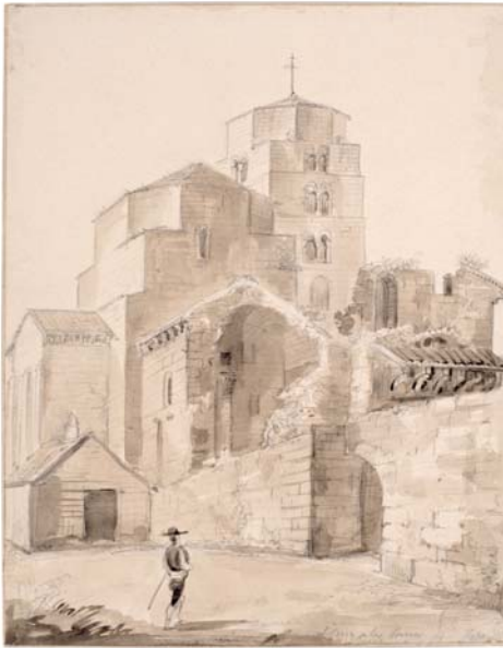
Vista exterior de la iglesia de Santa María de Santa Cruz de la Serós. Valentín Carderera y Solano. Lápiz y aguada sepia. 26,9 x 21 cm. Madrid, Fundación Lázaro Galdiano.