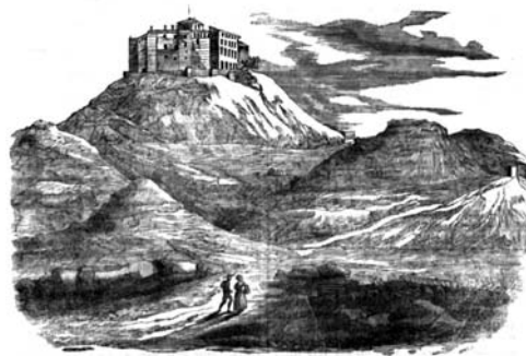
El Monasterio de Montearagon.