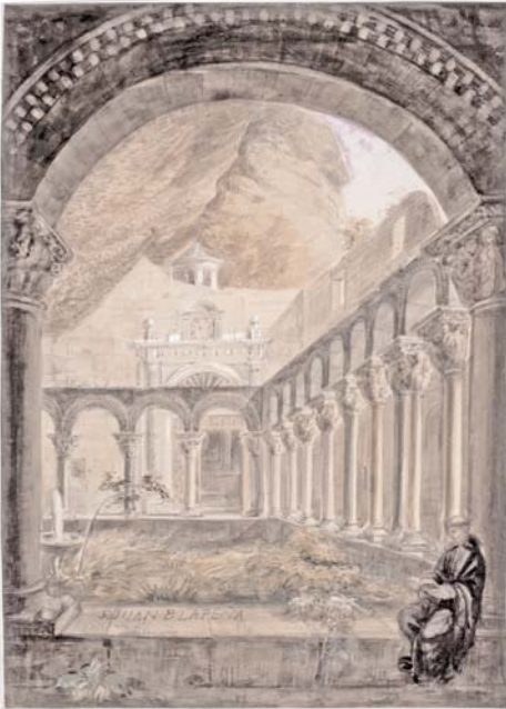
Claustro de San Juan de la Peña. Valentín Carderera y Solano. Lápiz y aguada de color. 36,2 x 25,8 cm. Madrid, Fundación Lázaro Galdiano.

El conjunto de los dibujos de tema aragonés responde a estas mismas líneas de análisis; en ellos predominan dos temáticas: por un lado, el arte religioso medieval y, por otro, la arquitectura civil de los siglos XVI y XVII. Si atendemos al Alto Aragón, el