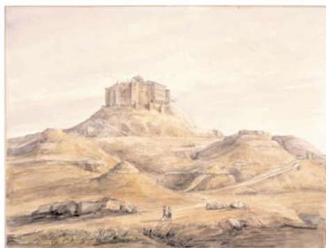
Castillo de Montearagón. Valentín Carderera y Solano. Lápiz y aguada de color. 21,4 x 27,7 cm. Madrid, Fundación Lázaro Galdiano.