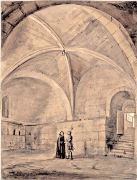
Huesca, edificio de la Universidad Sertoriana: sala de la Campana. Valentín Carderera y Solano. Lápiz negro y aguada de color. 28,2 x 21,8 cm. Madrid, Fundación Lázaro Galdiano.