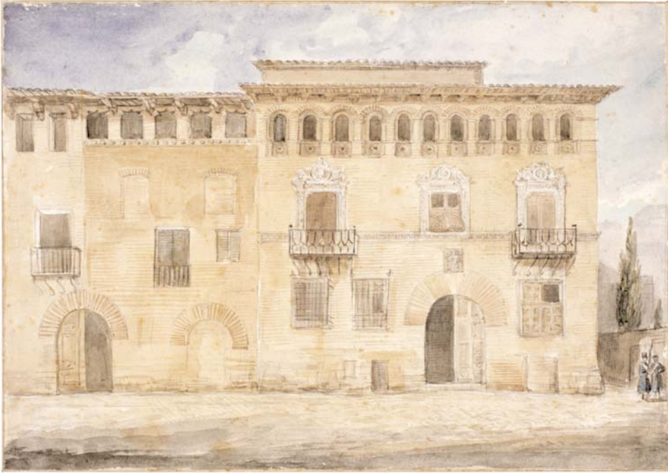
Huesca: casa de los Climent (inscripción: “Antigua casa de los Climent, llamada de don Antonio Aguirre”). Valentín Carderera y Solano. Lápiz y aguada de color. 22,5 x 31,1 cm. Madrid, Fundación Lázaro Galdiano.

en 1918. 100 En este artículo, que dice seguir punto por punto ese manuscrito original, Del Arco va detallando calle por calle los palacios y edificios singulares de la ciudad y haciendo referencia a los escudos de armas de sus fachadas, así como a las galerías de retratos que en ellos se conservaban, como por ejemplo en la casa de los Climent. 101 Son una vez más los símbolos de las elites del pasado, sus palacios, sus retratos y su heráldica, los que centran la labor erudita de Carderera.