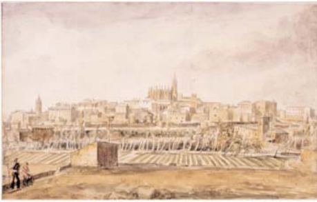
Vista de Huesca. Valentín Carderera y Solano. Lápiz y aguada de color. 30 x 48 cm. Madrid, Fundación Lázaro Galdiano.