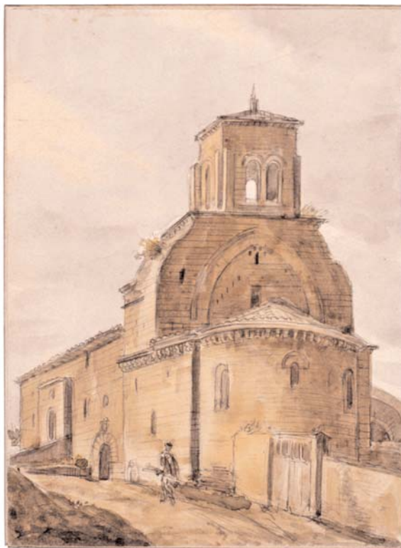
Huesca: iglesia de San Juan de Jerusalén. Derribada en 1849. Valentín Carderera y Solano . Lápiz y aguada de color. 16 x 11,8 cm. Madrid, Fundación Lázaro Galdiano.

dados en 1845 a San Pedro el Viejo de Huesca por iniciativa del Liceo Artístico y Literario. 93 De hecho, la memoria de este sepulcro desaparecido solo se conserva gracias al grabado que Carderera incluye en su Iconografía española . Algunos años antes de su publicación, el oscense hacía referencia al destino de estos panteones reales: