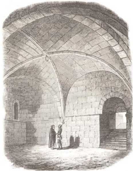
Huesca: sala baja en el Palacio de los Reyes de Aragón llamada "La campana de Huesca". Xilografía publicada en El Museo Universal, 8 (24 de febrero de 1867), p. 61.