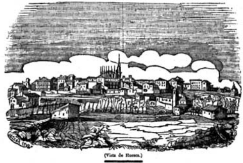
Vista de Huesca. Xilografía publicada en Semanario Pintoresco Español, 17 (24 de abril de 1842), p. 136.