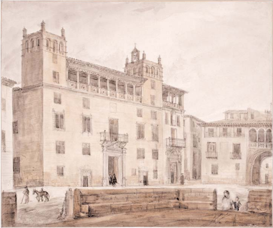
Huesca: Ayuntamiento. Valentín Carderera y Solano. Lápiz y aguada de color. 26,6 x 31,6 cm. Madrid, Fundación Lázaro Galdiano.

Además de este importantísimo fondo hemos localizado un segundo de menores dimensiones en la sección de Bellas Artes de la Biblioteca Nacional de España, donde se custodian unos 147 dibujos y acuarelas catalogados como obra de Carderera. A propósito de esta sección hay que señalar que tiene su origen precisamente en la compra por parte del Estado de la colección de dibujos y grabados del oscense en 1868. 60 Sin embargo, los dibujos a los que nos referimos aquí no llegaron a la Biblioteca Nacional entonces, sino en un lote comprado por el Estado a los herederos de Valentín Carderera en 1940. 61