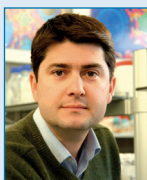
J. García Martínez

En el primer caso, para aquellos elementos que sólo presentan un isótopo estable, el peso atómico es una constante que coincide con la suma de la masa de protones y neutrones (valor al que llamamos masa atómica) y por lo tanto éste es el valor que debe aparecer en la tabla periódica. Los elementos de los grupos 2 y 3 tienen más de un isótopo estable y por lo tanto su peso atómico dependerá de la abundancia relativa de estos isótopos en la naturaleza. Si la variación en el peso atómico es menor que la precisión con la que podemos hacer la medida (grupo 2) está bien claro que el valor que debe aparecer en las tablas periódicas es el de la