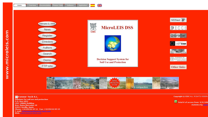
FIGURA 2. PANTALLA DE ENTRADA A MICROLEIS

En la figura 2 se muestra la pantalla de entrada a MicroLEIS.