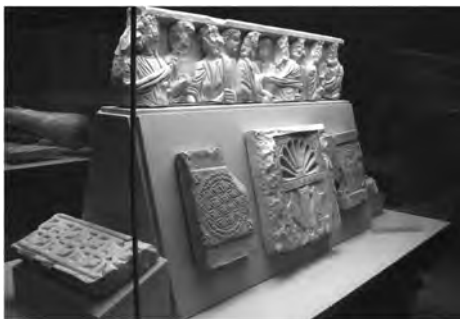
Fig. 5: Museo de San Vicente, exhibición de piezas visigodas

Sin embargo, los arqueólogos e historiadores sabían que la premisa de prioridad u originalidad no era válida, porque si la identidad cristiana de la catedral podía ser cuestionada con la presencia previa de una mezquita, entonces la identidad musulmana de la mezquita podía ser cuestionada con la aun más previa existencia de la iglesia de San Vicente. Para recalcar este punto, en enero de 2005 una selección de materiales visigodos y romanos hallados en el lugar fueron sacados del depósito y puestos en exhibición. Estos materiales incluían capiteles de columnas grabados, esculturas figurativas, fragmentos de altares, una fuente con ornamentos geométricos visigodos y, de manera muy especial, crucifijos (ver la figura 5). Los artefactos fueron suplidos con fotografías de las excavaciones de los años treinta que muestran un plano del suelo que deja ver las huellas de filas y ábsides de la iglesia visigoda reveladas gracias al trabajo arqueológico (ver la figura 6). Por último, un área del suelo de la mezquita que había sido excavada fue dejada abierta, revelando un mosaico de piedras pequeñas (que se cree perteneció a un edificio exterior de la catedral visigoda) a una profundidad de aproximadamente tres metros. En resumen, los curadores de la catedral-mezquita crearon el Museo de San Vicente adentro de la catedral-mezquita.