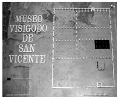
Fig. 6: Museo de San Vicente, plano de la mezquita que indica los ábsides excavados

Desde un punto de vista museológico, el trabajo está muy bien hecho, con una iluminación dramática y con etiquetas explicativas adecuadas. Pero la razón por la cual esta colección de materiales visigodos y romanos fue sacada a la luz ahora, y no