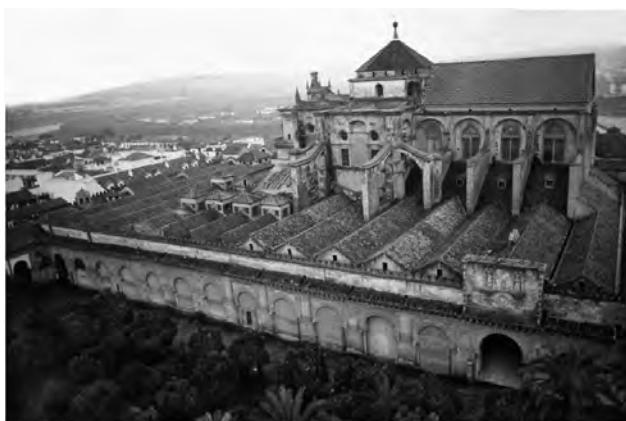
Fig. 4: Catedral-Mezquita de Córdoba, vista exterior

máticamente a Córdoba. En los años posteriores a 1492 España oficialmente se purga a sí misma de musulmanes y judíos, aunque en realidad hubo muchas personas que permanecieron allí, cristianos conversos pero aún inmersos en la cultura islámica andaluza. Pero en el siglo XVI la construcción sufrió un cambio dramático. En 1523 los arquitectos de Carlos V –el primer rey Habsburgo de España– removieron el centro de la venerable mezquita e insertaron un coro de catedral gótica, de modo que la mezquita se convirtió en el armazón de una nueva catedral (ver la figura 4). Irónicamente, este acto de destrucción –el cual el mismo Carlos V presuntamente consideró un terrible error– es posiblemente la razón por la cual esta mezquita aún sigue en pie, mientras que aquellas de Toledo, Granada, Sevilla y otras ciudades fueron demolidas y remplazadas completamente por enormes iglesias (para la preservación y restauración de la Mezquita de Córdoba, véase Edwards, 2001).