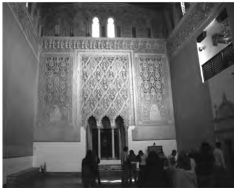
Fig. 9: Iglesia-sinagoga “El Tránsito”

La sinagoga sirvió a su comunidad judía menos de 150 años, mientras que el edificio fue usado como iglesia durante más de trescientos. Pero en este monumento, la previa reivindicación de los judíos (exiliados y reprimidos en 1492 junto con los musulmanes) y de la herencia judía ha sido celebrada al desconchar las fases cristianas posteriores del edificio y al restaurar su estado original como templo. Los adornos estucados de las paredes superiores han sido restaurados con el mayor cuidado, y las inscripciones escritas tanto en hebreo como en árabe son visibles, al igual que el escudo de Castilla, en deferencia con Pedro, protector