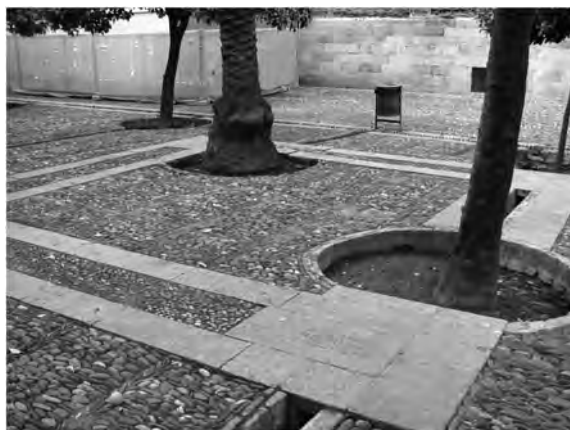
Fig. 8: Catedral-Mezquita de Córdoba, patio con antiguo alminar (ausente) indicado en el pavimento de piedras

Otro proyecto museológico ha sido el de inscribir en piedra el lugar donde el antiguo alminar alguna vez estuvo en pie en el patio actual (ver la figura 8). Este alminar fue demolido en el siglo X y reemplazado por una torre más grande en el norte, cuando la mezquita fue expandida durante el reinado de Abderramán III. La indicación de este lugar original no es intrusiva y, de hecho, muchos visitantes no se percatan de ella. Pero para quienes son históricamente conscientes, permite una presencia tangible de la antigua mezquita desaparecida sin interrumpir el espacio del complejo tal y como existe hoy en día.