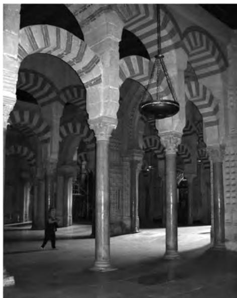
Fig. 1: Catedral-Mezquita de Córdoba. Interior de la sala original de oración