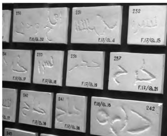
Fig. 7: Firmas de albañiles exhibidas en el Museo de San Vicente