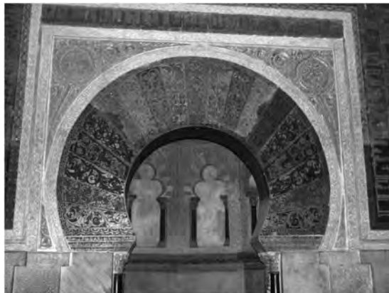
Fig. 3: Catedral-Mezquita de Córdoba, Mihrab

imágenes de la vegetación frondosa y las inscripciones que enmarcan el nicho y las “dovelas” (falsas, pues son referenciales y no estructurales).