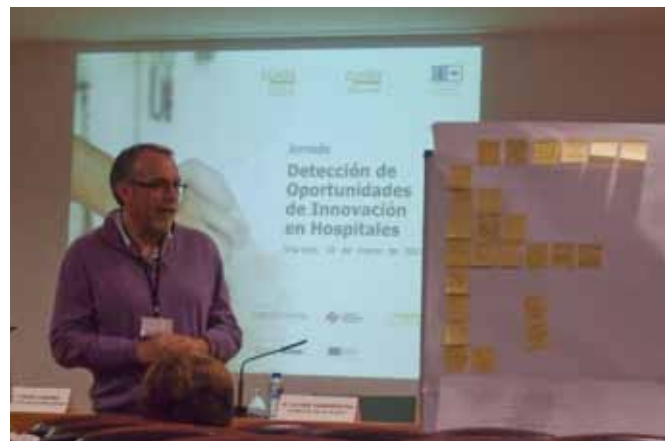
Figura 3. Sesiones de discusión.