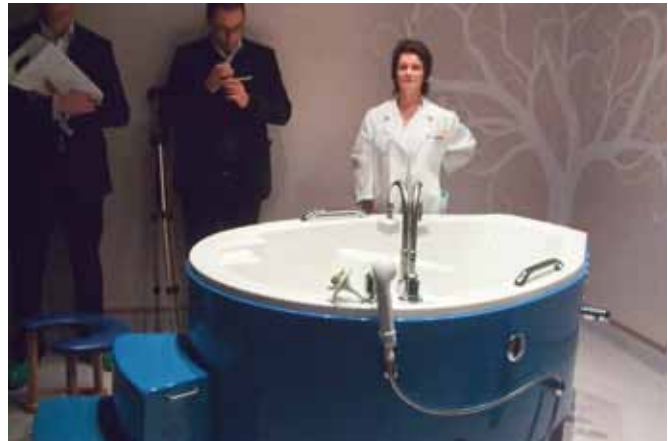
Figura 2. Imágenes de la visita guiada.