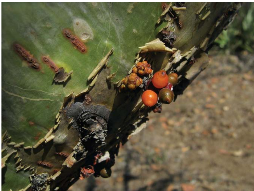
Phoradendron perredactum de Morelos. Fotografías de Esteban Martínez.