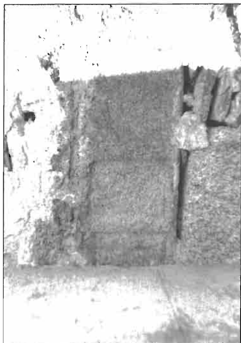
Inscripción. N.º 1