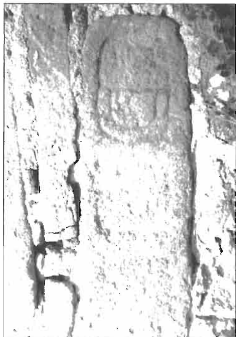
Inscripción. N.º 2