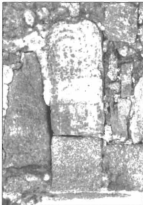
Inscripción. N.º 4