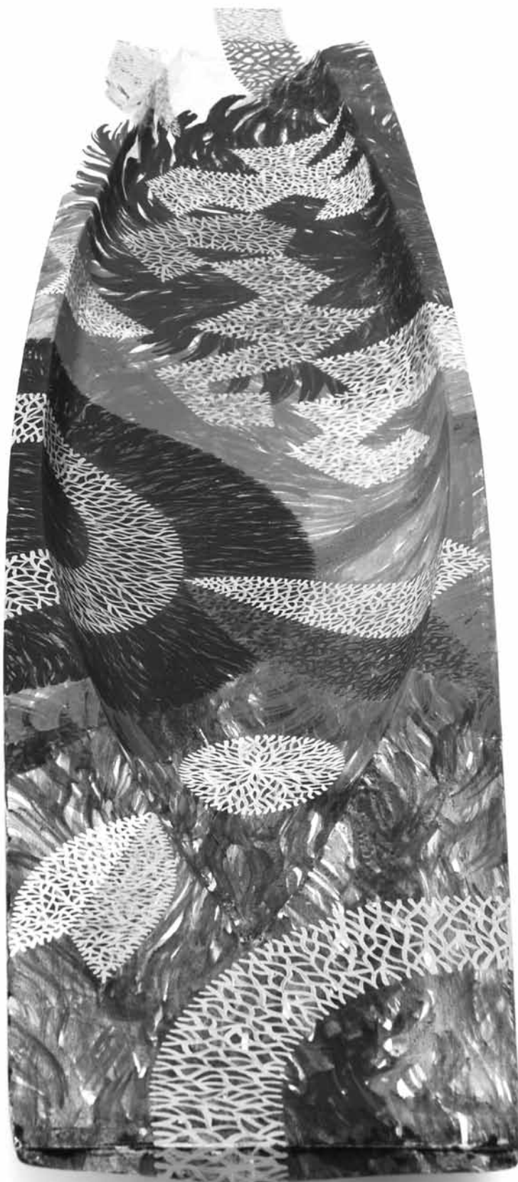
Pensador de Río Verde , acrílico sobre canoa de madera, 2007

BENJAMÍN JACANAMIJOY TISOY