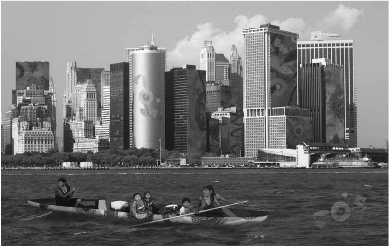
Pensamiento de Uaira Uaua en el Río Hudson. Intervención fotográfica, 2009. 70 x 100 cm | BENJAMÍN JACANAMIJOY TISOY

mundo imaginario de colores con sabor a cupuaçu , guaraná y açaí .