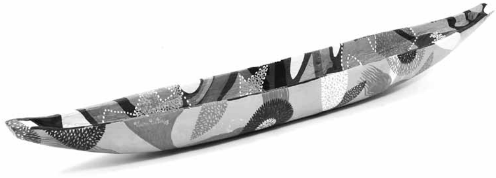
Pensador de agua, acrílico sobre canoa de madera, 2007

En cuanto al color, para escribir sobre la cromática del maestro, mi pensamiento fluye por el camino de la planta del yagé, porque su técnica de color desdobra la luz del sol cayendo sobre las plantas de bejucos florecidos. En una ceremonia que realicé en el desierto de La Guajira, vi que de la arena surgían plantas que florecían en colores intensos y varia-