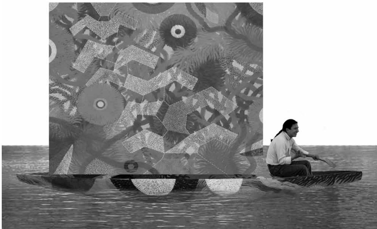
En el lugar del maíz de sol , acrílico sobre lienzo, 168 x 188 cm, 2007 Pensador de agua delfín , acrílico sobre canoa de madera, 420 cm, 2009 Intervención fotográfica, 2009. 70 x 100 cm | BENJAMÍN JACANAMIJOY TISOY