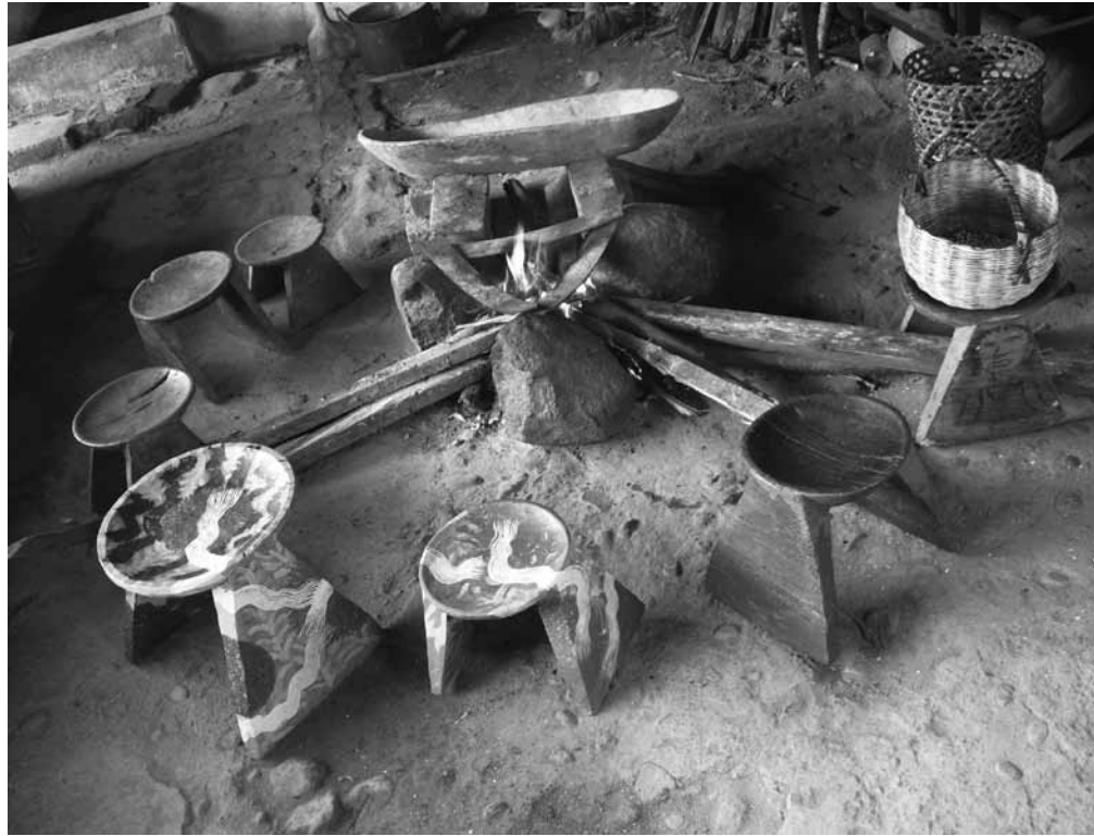
En el lugar del fuego , fotografía, 2009 | 70 x 100 cm BENJAMÍN JACANAMIJOY TISOY | FOTOGRAFÍA UAIRA UAUA

Me ha contado también que creció participando desde niño en los actos ceremoniales y festivos celebrados en Manoy Santiago en el Valle de Sibundoy. Para él, la fiesta del Atun Puncha: el Gran Día o Kalusturinda, también llamada del arcoiris , es una de las actividades más importantes de los ingas, y su familia participa activamente en su preparación. Durante la