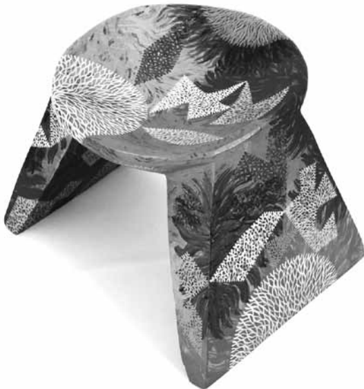
Pensador de música , acrílico sobre banco de madera, 2007

BENJAMÍN JACANAMIJOY TISOY