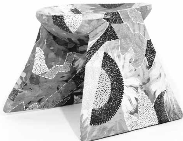
Pensador de mujer , acrílico sobre banco de madera, 2007