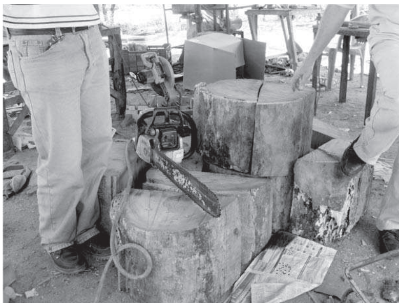
Figura 1 Detalles de un taller de artesanía de madera, estado Lara

Hidalgo (1999) sobre las especies arbóreas, se hicieron varios reconocimientos sobre la insostenibilidad del modo de producción de las tallas. Entre las situaciones resaltadas por los artesanos, se señalaron: la creciente dificultad para obtener las materias primas, así como la ilegalidad de su utilización, e incluso la utilización de madera fresca (verde) lo cual afecta la calidad de las obras. Lo importante fue, que en el proceso de reflexión colectiva se hicieron planteamientos como la necesidad de sembrar, la incompatibilidad de las siembras con la explotación caprina extensiva, la posibilidad de sustituir las especies utilizadas por algunas maderas comerciales (de aserradero), entre otras. En la Figura 1, se observa un taller con muestras de explotación de materias primas locales.