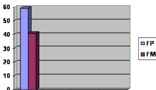
Gráfico 1. Producción total de formas de futuro

En las 120 pruebas analizadas encontramos 204 formas de expresión de futuro, de las cuales 121, un 59%, corresponden al futuro perifrástico y 83, un 41%, al futuro morfológico.