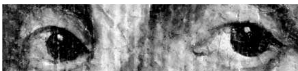
5. Retrato inédito del Duque de Neoburgo (detalle).