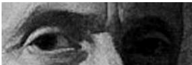
4. Retrato de Góngora (detalle).