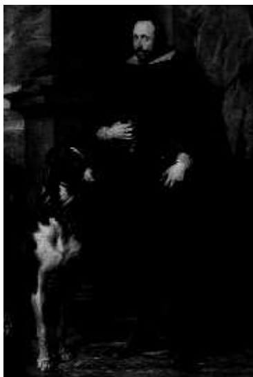
2. ANTHONY VAN DYCK: Retrato de Wolfgang Wilhelm von Pfalz-Neuburg . Alte Pinakothek, Munich.