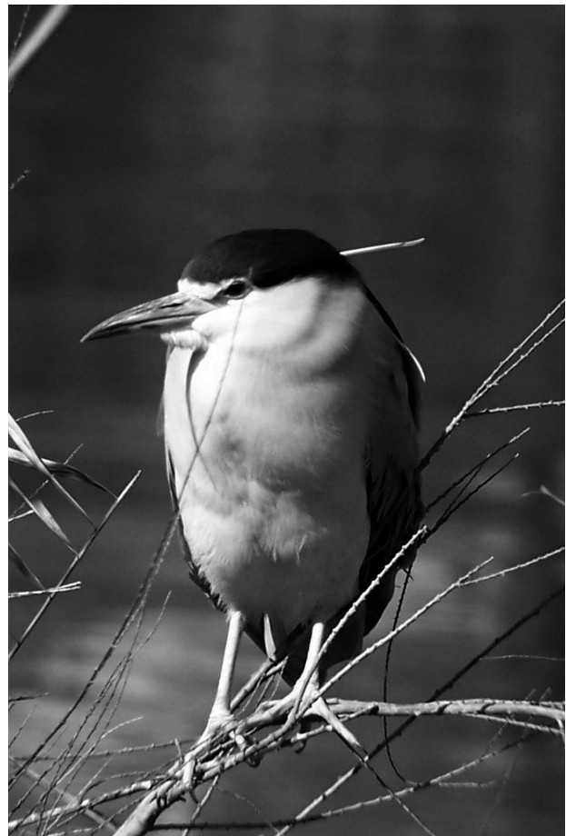
Martinete adulto. (T. Sanz)

ble también en la provincia de Palencia, en la laguna de la Venta de Valdemudo durante los años 1997 y 1998 (Jubete, 2005).