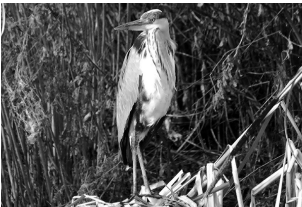
Garza real. (J.A. Arriola)

Esta garza, quizá la más conocida por la gente de las que se presentan en nuestra provincia, se reproduce en León desde el año 1998, año en el que se localizó una pareja en la zona de La Maragatería. Su población reproductora fue creciendo hasta las 51 parejas en el año 2001 (IMAVE, 2000; Fernández, 2008d), 102 en el año 2005, 121 en el 2006 (IMAVE, 2006) y continúa haciéndolo en la actualidad. Todos los nidos están instalados en árboles (pino piñonero, encina y chopo). Actualmente una pareja se reproduce sobre vegetación helófito (juncos y carrizos) en el interior de la Laguna Grande de Bercianos del Real Camino, de donde volaron dos pollos en la temporada de cría de 2009 (J.A. Arriola, datos propios). Parece ser que en este enclave ya hubo un intento de cría de una pareja en 1991, sin que finalmente se pudiese confirmar la nidificación con éxito (Alegre et al. , 1991; Palacios y Campos, 1991). En Castilla y León este sustrato de nidificación se ha encontrado también en el pantano de San José del Duero, en Valladolid (IMAVE, 2000; Sanz-Zuasti y Velasco, 2005). En las zonas de la provincia donde no cría se pueden ver ejemplares durante todo el año, aunque es en invierno cuando la llegada de aves europeas aumenta en gran medida su número, siendo entonces observadas incluso en zonas de montaña (Sanz, 2006, 2009). No obstante, una