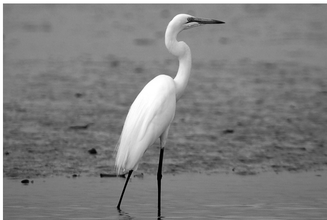
Garceta grande. (T. Sanz)

al río Esla aguas arriba de Castrofuerte en 1976. En 1982 la colonia se trasladó a una zona similar junto a Valencia de Don Juan, desapareciendo poco después. Definitivamente se instalaron 29 parejas en el año 1991 entre Castrofuerte y Villaornate (Palacios y Campos, 1991). Así, la población fue en moderado aumento hasta 1995, con 96 parejas, sufriendo desde entonces un lento declive, hasta las 76 parejas del año 2000 (IMAVE, 2000), 55 en 2001, 35-40 en 2003 (Fernández, 2008b) y las 50 del año 2006 (IMAVE, 2006). Debido a múltiples molestias en la zona de nidificación (incluso disparos a los nidos), las parejas se fueron reinstalando desde el año 1997 en la Gravera de San Pelayo, en Villazala, y en la Laguna de Villadangos, única zona de cría en el año 2006 (IMAVE, 2006), a la espera de los resultados del nuevo censo. En los últimos años de los 90 del siglo XX se originó una zona de concentración postnupcial en el casco urbano de León capital, en la confluencia de los ríos Bernesga y Torío (IMAVE, 2000), y un juvenil fue recogido junto a la localidad de Astorga el 23.08.1999 herido por un disparo (T. Sanz, datos propios).