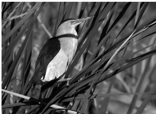
Avetorillo común. (M. Ehrlich)