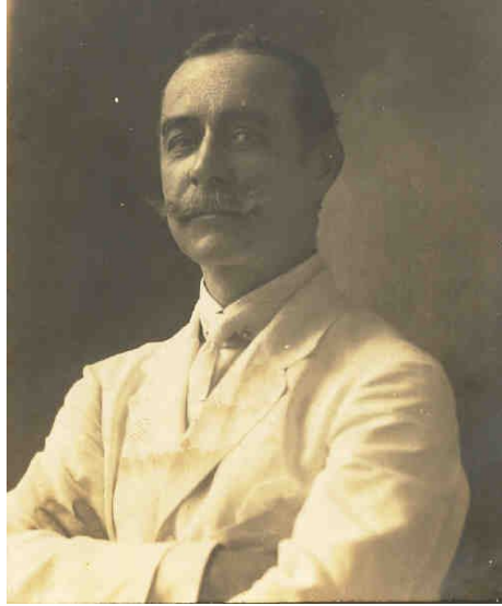
José Ignacio de Almagro y Elizaga