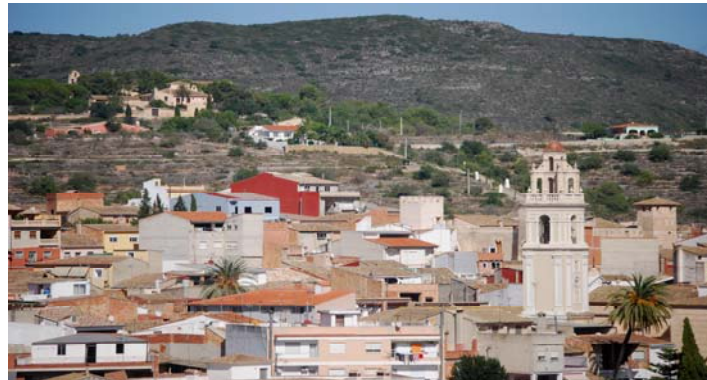
Figura 1: Vista panorámica de la ciudad de Llutxent

tienen alineaciones y dirección definida, quedando el final de la Serra Grossa al norte y el Benicadell al sur.