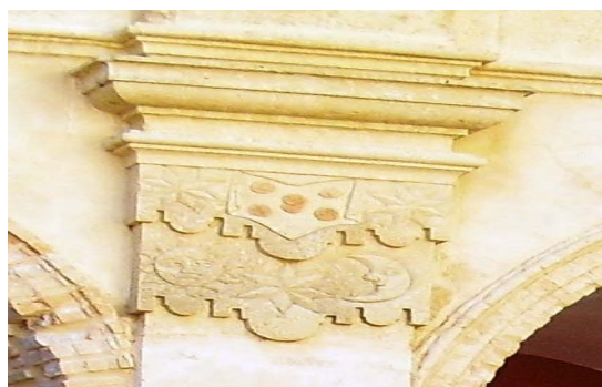
Figura 2: Pilastras del primer piso del claustro del Monasterio del Corpus Christi donde se observa la imagen de Los Corporales