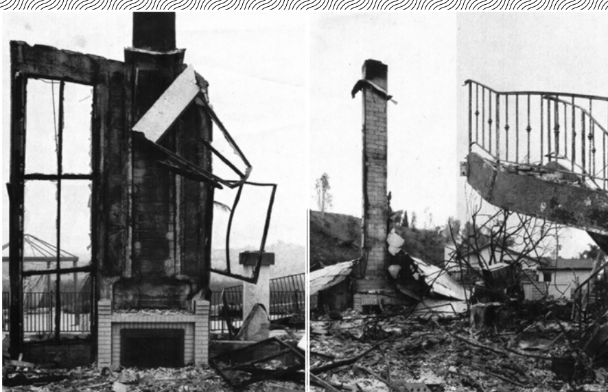
04 FOTOGRAFÍAS DE SASHA BEZZUBOV