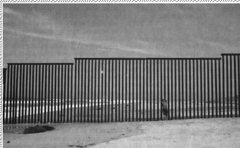
05 NO COMMENT