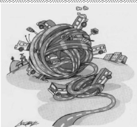
03 FOTOGRAFÍAS DE CEDRIC GERBEHAYE