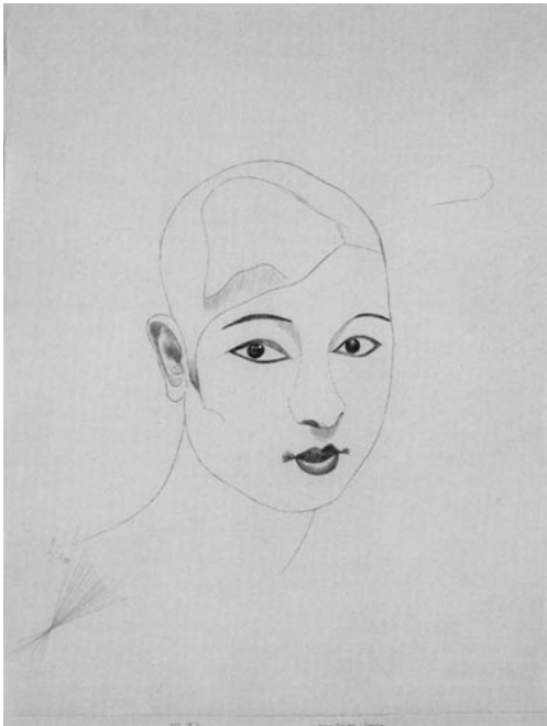
5 NEGROID BEAUTY, 1927

una Mujer de Sociedad (1932). La última obra mencionada, compuesta por cuatro variaciones del mismo retrato, en el que se resaltan diferentes rasgos del rostro en cada una, nos remite a la obra posterior de Warhol, como sugiere el texto de la sala.