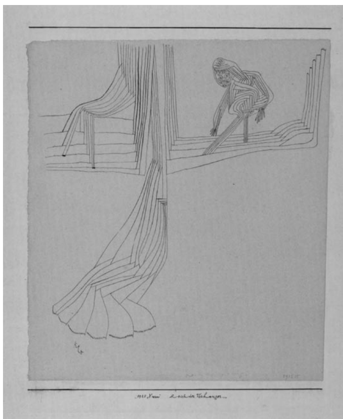
2 REALM OF THE CURTAIN. 1925