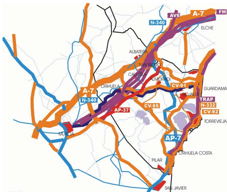
Figura 2. Infraestructuras de transporte previstas en la comarca de la Vega Baja 2009-2020.

En el caso del AVE en la primera opción que se presentó desde Fomento este discurriría paralelo a la A-7 siendo sus impactos prácticamente nulos para la huerta tradicional. En cambio, dicho proyecto se abandona a favor de uno con más impactos negativos y además más costosos puesto que supone unas mayores expropiaciones y además atraviesa varios núcleos urbanos en los que hay que acometer obras muy costosas para paliar sus efectos negativos.