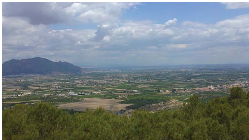
Fotografía 1. Valle aluvial de río Segura a su paso por Orihuela.

Autores: Naiara Marroquí Ferrández y Alejandro Cases Martínez. Fecha: junio 2011