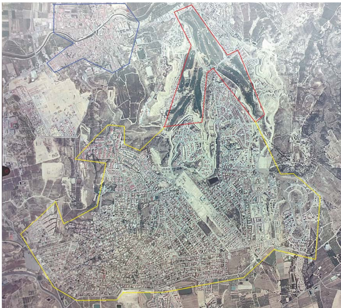
Figura 3. Fotografía aérea de Rojasles, 2002.