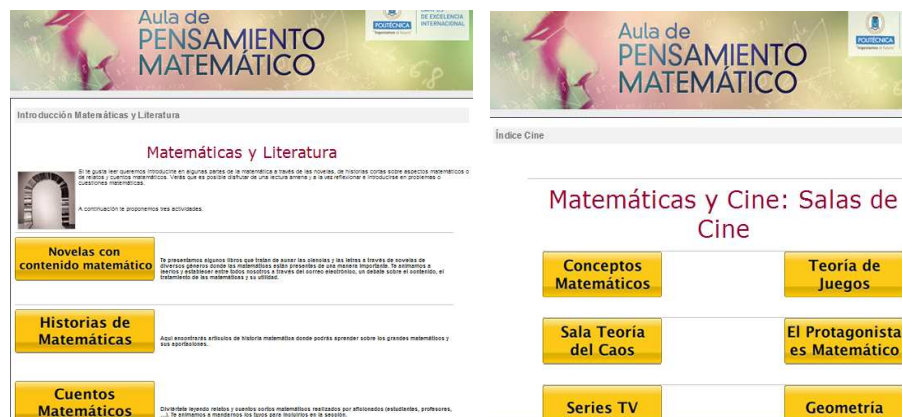
Figura 4. Pantallas dedicadas a la actividad “Matemáticas, cine y literatura”.