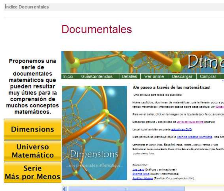
Figura 5. La actividad dedicada a documentales matemáticos.

A modo de ejemplo, hemos incluido en esta sección un enlace al documental “Dimensions” acompañado de este texto: Este documental te gustará si estás interesado en la Geometría, tanto en la clásica como en la más moderna. Con unas bellas animaciones se explican conceptos geométricos en distintas dimensiones, desde los más sencillos a conceptos elevados como las fibraciones, la proyección estereográfica,... Tienen la particularidad de que cada capítulo lo “presenta” un eminente matemático relacionado con el contenido del capítulo.