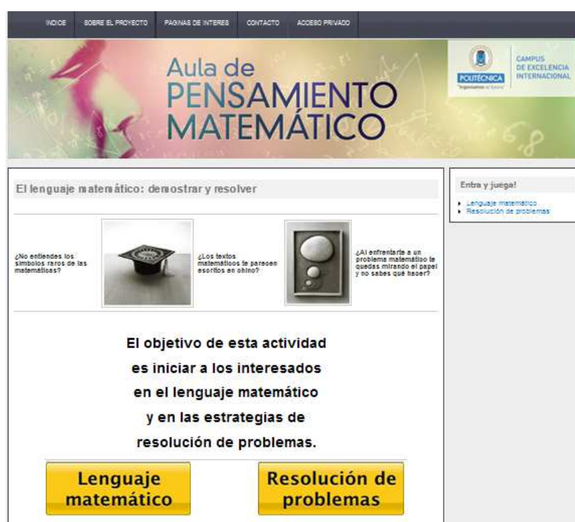
Figura 3. Cabecera de la actividad “El Lenguaje Matemático: Demostrar y resolver”.

La presentación de estas materias se hace a través de vídeos y documentos a disposición del visitante.