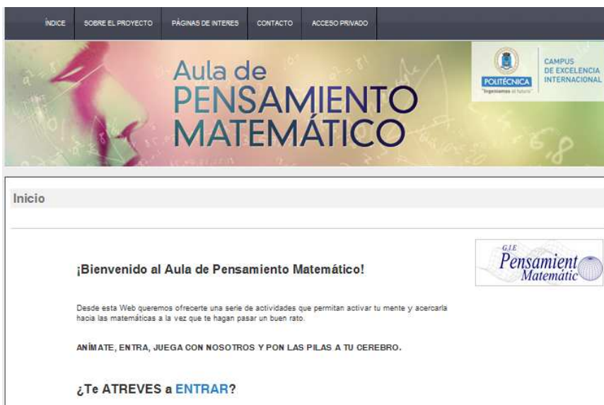
Figura 1. Pantalla de inicio del Aula de Pensamiento Matemático.

Para ello se propone una lista de actividades en el aula virtual que están en continua renovación y ampliación. Éstas son: