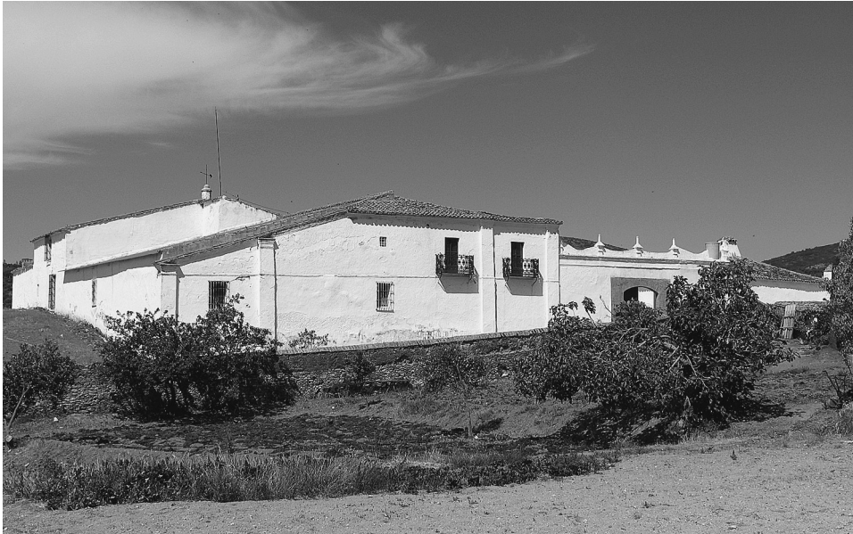
FIG. 11. Cortijo La Jayona. Fachada Sur.

que recogimos en su momento, aparece otra casa de campo «en el término llamado la Jayona», que estaba siempre habitada y pertenecía a «la Casa de San Marcos de León». Y además otra, cuyo terreno también estaba destinado a olivar, que «fue de los Religiosos Expulsos y oy de la cartuja de Cazalla». En esta última vivían algunos trabajadores, mientras que un lego de dicha orden iba a ella de manera temporal. La producción oleícola, a la que constantemente nos estamos refiriendo, queda patente en la existencia de ciertos molinos de aceite asociados a este conjunto.