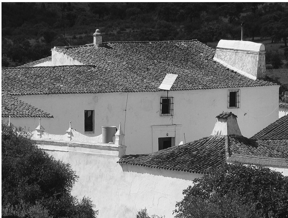
FIG. 12. Cortijo La Jayona. Vivienda principal.

«(...) camino adelante a la Dehesa de fuente el Arco por entre las dos Jurisdicciones y de esta a el sitio de las malpicas, Zerro pino, Sittio de el pencon y Bodega en donde se introduce la cañada por un cortto trecho en el término de Reyna y luego vuelve entre las dos Jurisdicciones hasta la hermita de el Sargento tendiendo la cuerda y haciendo mojones, renobando los antiguos, cañada adelante hasta la Hermita de nuestra Señora de la Ara y de esta a el sitio de el Pencon (...)».