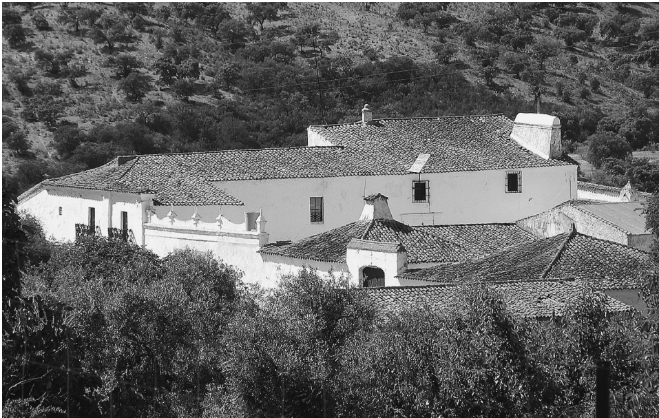
FIGS. 9 Y 10. Cortijo La Jayona. Visiones generales.