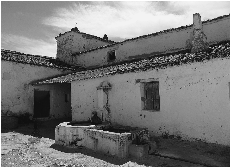
FIGS. 5 Y 6. Ermita de Nuestra Señora del Ara. Dependencias residenciales.