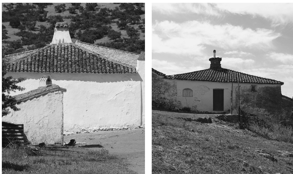
FIGS. 7 Y 8. «Tribunas» del Cortijo La Jayona y Ermita de Nuestra Señora del Ara.

En este sentido, es semejante a otras como la del Caserío de La Garza (Oliva de Mérida), fechada en 1774 14 .