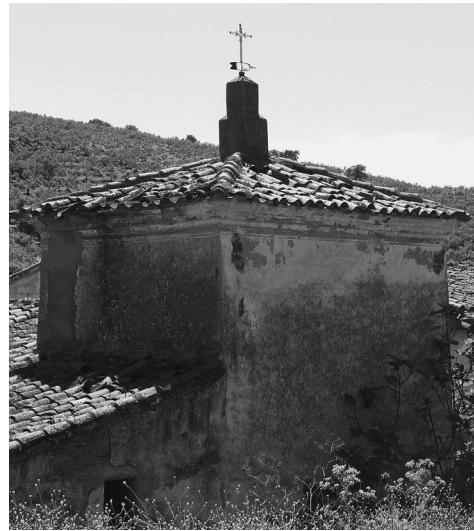
FIGS. 2, 3 Y 4. Cortijo Santa Cruz. Parte oriental y detalles.

Cerro del Grullo, Las Cruces, Encinalejo, El Galapagar, La Parrilla y El Cristo, donde existían entonces una « casa y molinos de aceite y harina » con una población de 11 personas.