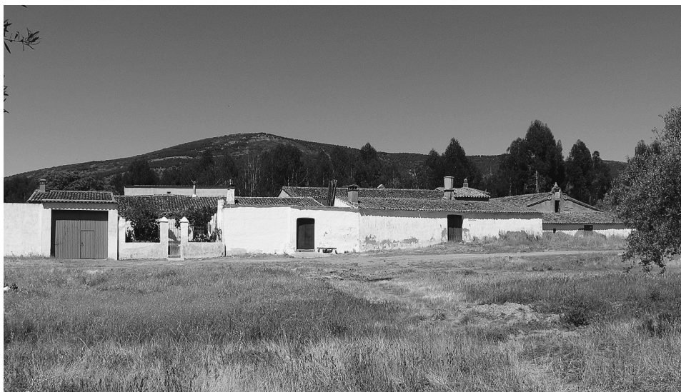
FIG. 1. Cortijo Santa Cruz. Visión general.

Por otro lado, en el Nomenclátor de 1863 10 se registran bastantes casas de campo y cortijadas en este término. Así, las denominadas Arroyo, Barrillos, Bermejales, Bodeguilla Blanca, Buenavista, Cabeza-García, Cortaza, Cuesta del Sargento, Fontana, Fuente del Parral, Gumaz, La Magdalena, Merinales, Moral, La Nava, Pencón, Piletas, Prado Gil, La Sierra, Valdecabrera, El Valle, Vereda o Viar.