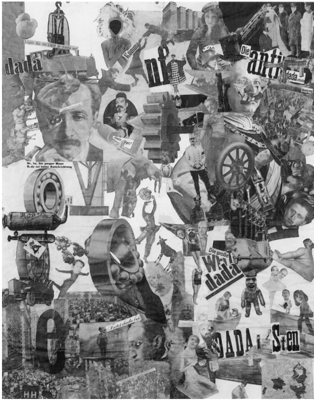
FIG. 5. Hannah Höch , Corte con el cuchillo dadá de cocina a través de la última época de la cultura de barriga cervecera de la Alemania de Weimar, 1919-1920.