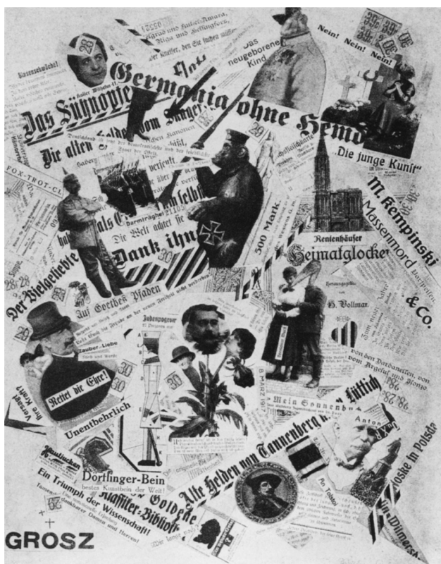
FIG. 4. George Grosz, Germania ohne Hemd [Alemania sin camisa], publicado en Der Blutige Ernst, n.º 6, Berlín, 1919.