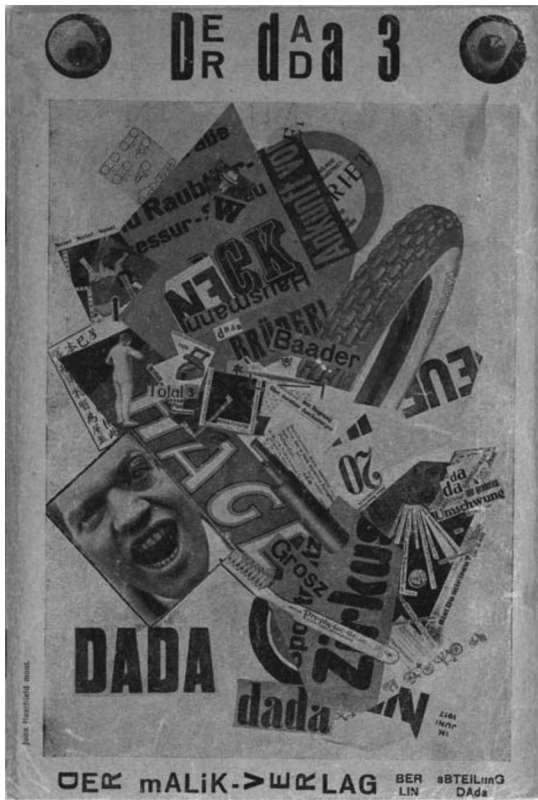
FIG. 1. John Heartfield, Fotomontaje para la portada de Der Dada, n.º 3, Berlín, Malik, 1919.