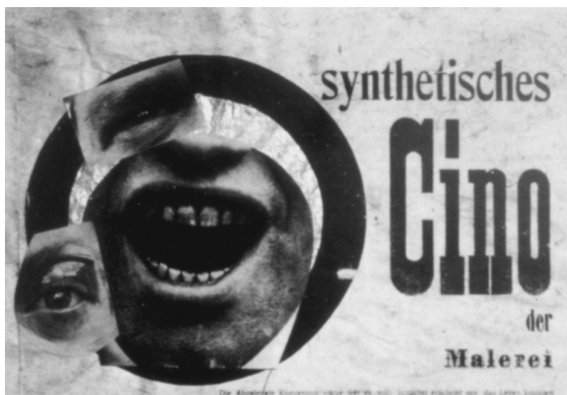
FIG. 3. Raoul Hausmann, Cine sintético de la pintura, Fotomontaje del panfleto, Berlín, 1918.