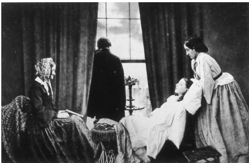
FIG. 2. Henry Peach Robinson, Desapareciendo, 1858.