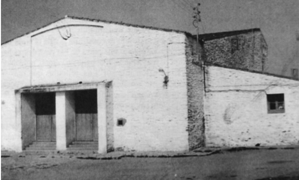
FIG. 3. Edificio Social y Casa de Hermandad. Fachada principal.