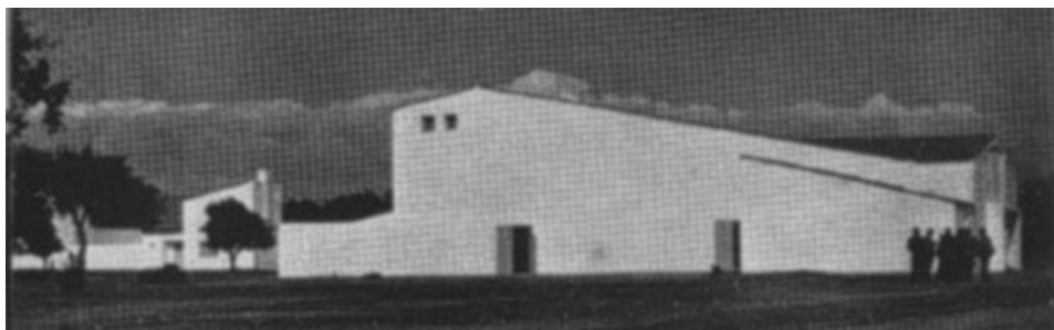
FIG. 2. Edificio Social y Casa de Hermandad (anterior a la construcción del cine de verano).

pleo de la pizarra enjabelgada con cal blanca ofreciendo un atractivo visual por las rugosidades de la piedra, materiales básicos sin adornos para expresar la belleza. Su exterior se caracterizaba por una geometría pura acentuada por la utilización de líneas simples, depuradas y ordenadas, reforzado por la vertiente de su tejado. Son las ventanas elementos básicos de la estructura de fachadas que dejan entrar la luz dotando a los espacios de una mayor iluminación. El edificio refleja la influencia de varias corrientes artísticas como el constructivismo ruso y el neoplasticismo que recoge el movimiento de la Bauhaus. Una arquitectura que se inclina cada vez más hacia el funcionalismo y el racionalismo, ensalzando lo elemental en detrimento de lo superfluo para intentar llegar a la esencia.