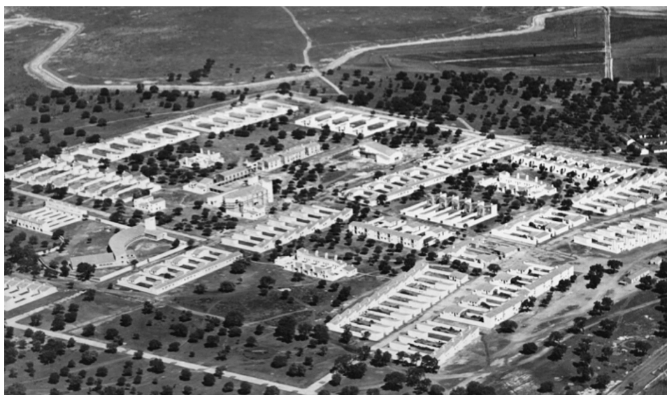
FIG. 1. Vista general de poblado de Vegaviana (Foto: Rafael Fernández del Amo).

inicial no se ejecutó en su totalidad. Primeramente hay que señalar que la Casa de Hermandad no se llegó a construir y tal vez debamos asociarlo a la escasez de medios económicos y los recortes presupuestarios derivados del I.N.C. En segundo lugar, el espacio destinado a la proyección de películas al aire libre no siguió los parámetros originarios puesto que no se llevará a cabo su ejecución hasta la década de los 60, casi diez años después de la inauguración del cine y salón de actos.